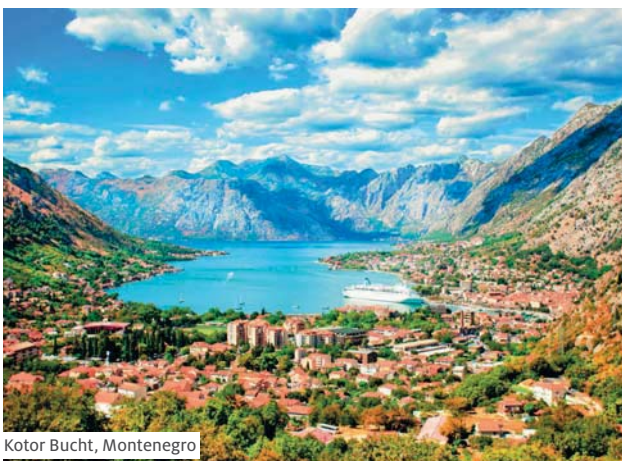
Kotor Bucht, Montenegro