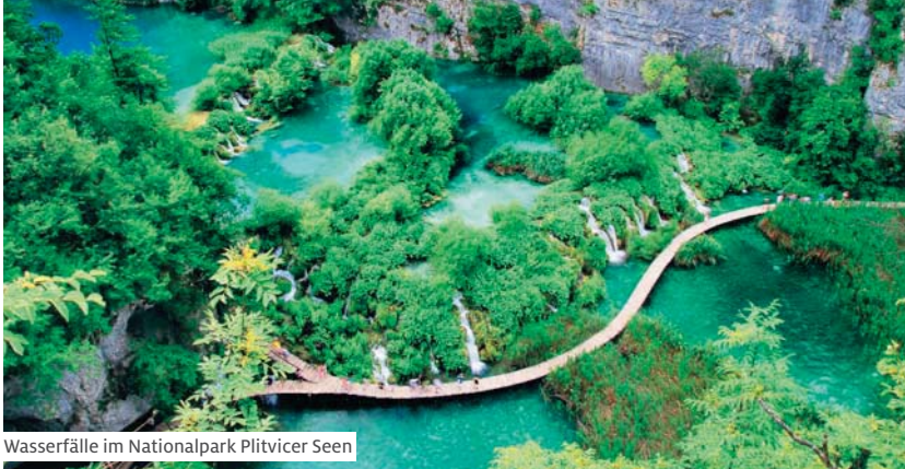
Wasserfälle im Nationalpark Plitvicer Seen