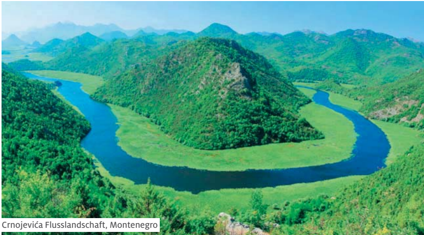
Crnojevića Flusslandschaft, Montenegro