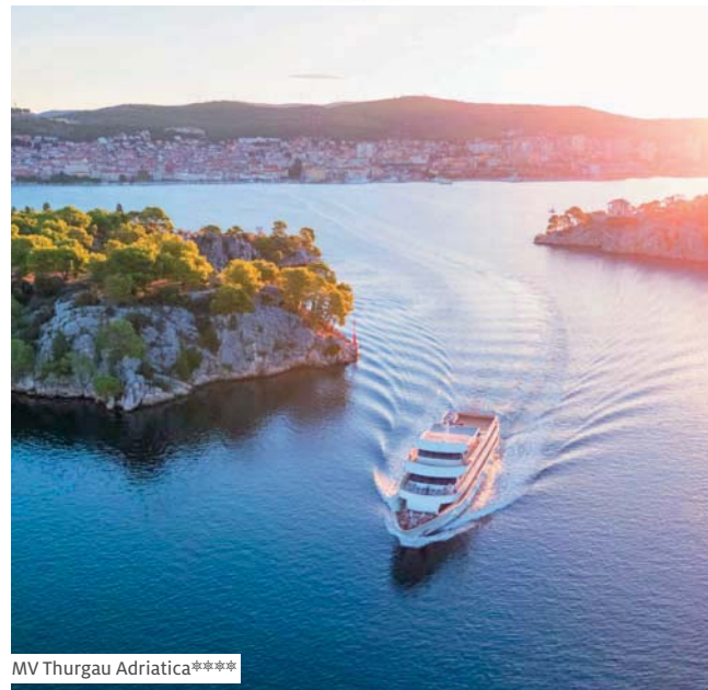
MV Thurgau Adriatica ****