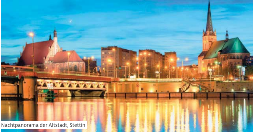
Nachtpanorama der Altstadt, Stettin