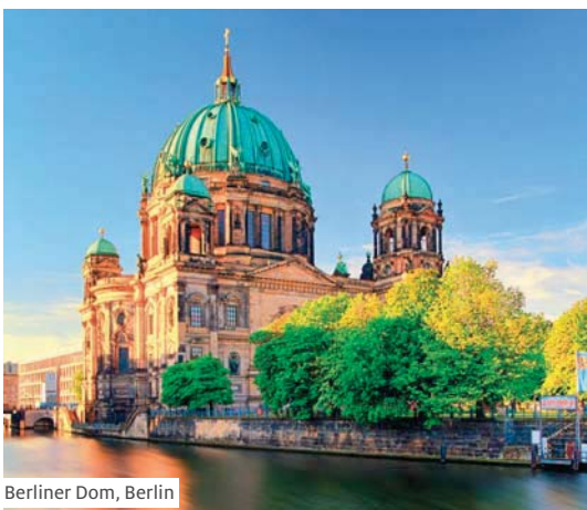
Berliner Dom, Berlin