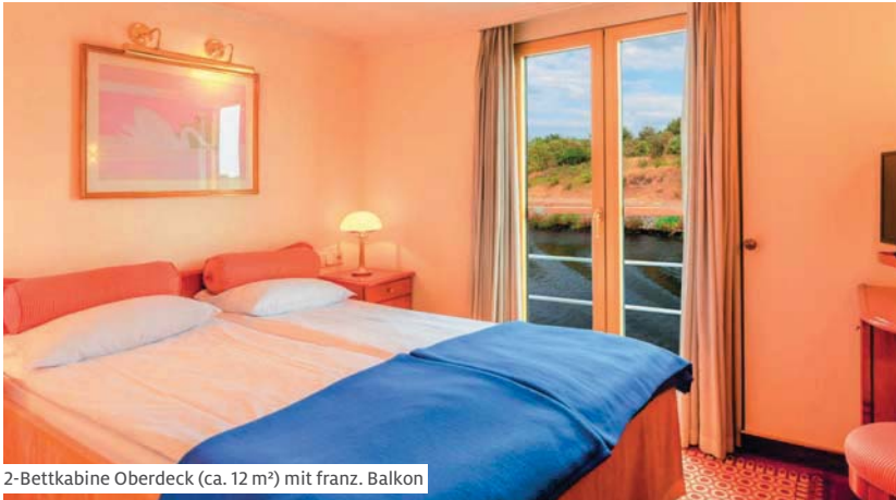
2-Bettkabine Oberdeck (ca. 12 m 2 ) mit franz. Balkon