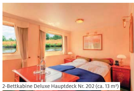
2-Bettkabine Deluxe Hauptdeck Nr. 202 (ca. 13 m²)