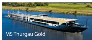
MS Thurgau Gold

Schiffsbeschreibungen und inbegriffene Leistungen siehe separate Seite.