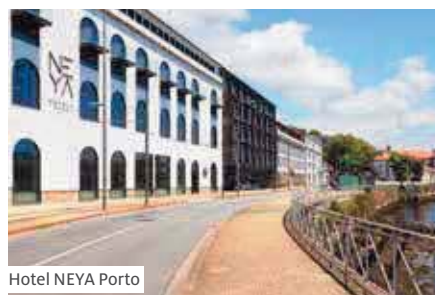
Hotel NEYA Porto

Alle Ausflüge gemäss Programm inbegriffen | (3) Im An- und Rückreisepaket enthalten | F=Frühstück, M=Mittagessen, A=Abendessen Programmänderungen vorbehalten