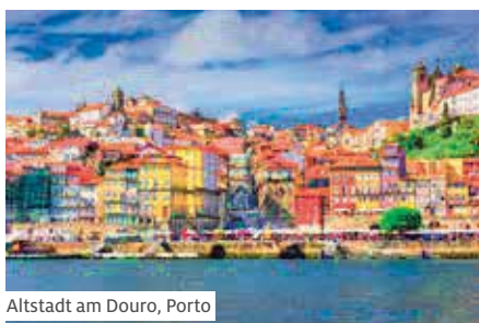
Altstadt am Douro, Porto

Zihlmann Zeitreisen AG - Wehntalerstrasse 470 8046 Zürich - Tel. 052 624 88 19 www.zihlmann-zeitreisen.ch wuensche@zihlmann-zeitreisen.ch