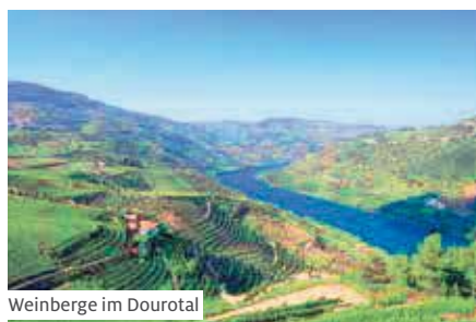
Weinberge im Dourotal