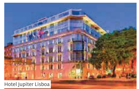
Hotel Jupiter Lisboa