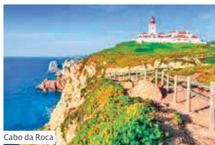
Cabo da Roca