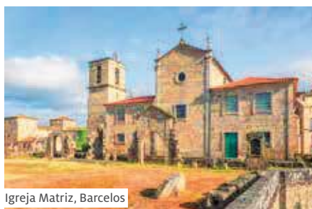
Igreja Matriz, Barcelos

Nicht inbegriffen: Übrige Mahlzeiten und Getränke, Trinkgelder, City-Taxen Porto (ca. € 6 p.P.)