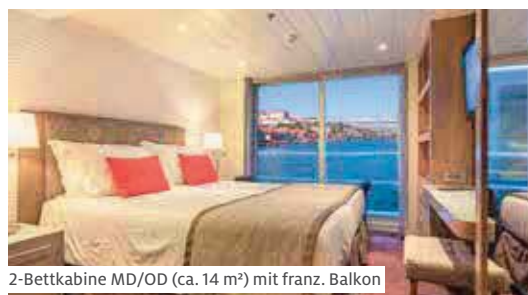
2-Bettkabine MD/OD (ca. 14 m 2 ) mit franz. Balkon