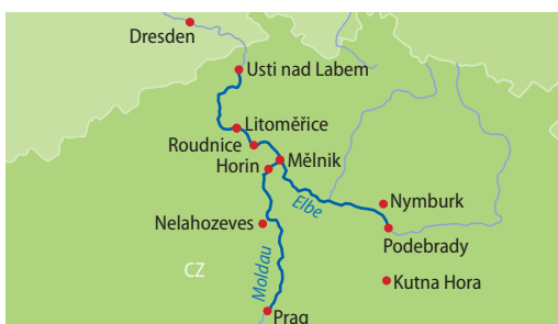
Barbara Kirche, Kutna Hora

Ausschiffung nach dem Frühstück und Bustransfer via Hetzenhausen (Mittagessen auf eigene Kosten) in die Schweiz. Ankunft in St.Margrethen um ca. 17.30 Uhr und in Zürich Sihlquai um ca. 19.00 Uhr. Individuelle Heimreise.