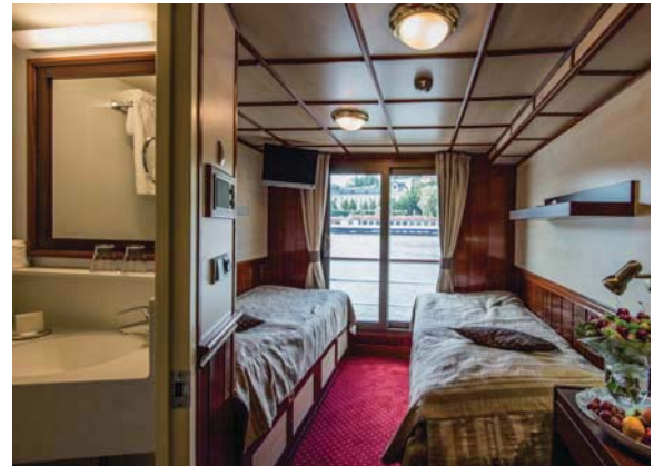
2-Bettkabine Oberdeck mit franz. Balkon

Es het solangs het Rabatt* bis Fr. 300.- *Abhängig von Auslastung, Saison, Wechselkurs