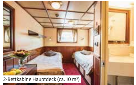
2-Bettkabine Hauptdeck (ca. 10 m²)

Das gemütliche Mittelklasseschiff wurde ab 2013 kontinuierlich renoviert. Es bietet 86 Gästen in 46 Kabinen bequem Platz. Alle Kabinen (2-Bettkabine ca. 10 m², Einzelkabine ca. 8 m²) liegen aussen und verfügen über Dusche/WC, Föhn, Safe, TV sowie regulierbare Lüftung mit zentral gesteuerter Heizung/Klimaanlage. Die im Design unserer Burma-Schiffe gestalteten Kabinen haben auf dem Oberdeck einen französischen Balkon und auf dem Hauptdeck nicht zu öffnende Fenster. Gutbürgerliche, nationale und internationale Speisen werden im Restaurant mit Bar serviert. Bequemem Aufenthalt bieten die kleine Lounge bei der Réception sowie der Panorama-Salon auf dem Oberdeck. Das grosse Sonnendeck mit Stühlen und Liegen lädt ein zur Erholung und Entspannung während der eindrucksvollen Fahrt entlang der Moldau und der Elbe. Gratis WLAN nach Verfügbarkeit. Nichtraucher-schiff (Rauchen auf dem Sonnendeck erlaubt).