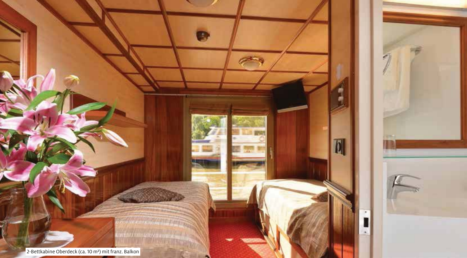
2-Bettkabine Oberdeck (ca. 10 m²) mit franz. Balkon