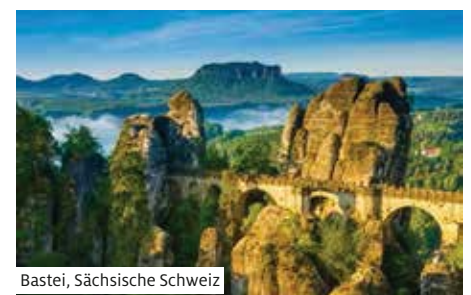
Bastei, Sächsische Schweiz