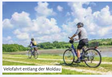
Velofahrt entlang der Moldau