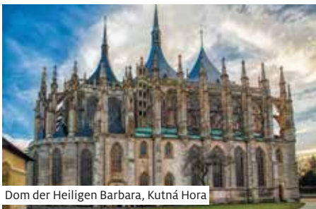
Dom der Heiligen Barbara, Kutná Hora

Die «Goldene Stadt» beeindruckt mit der weltberühmten Karlsbrücke und vielen weiteren Sehenswürdigkeiten. Während des Rundgangs (1) durch die Altstadt sehen Sie unter anderem auch die Astronomische Uhr am Rathaus. Nach dem Abendessen empfiehlt sich der Besuch (2) eines klassischen Konzerts.