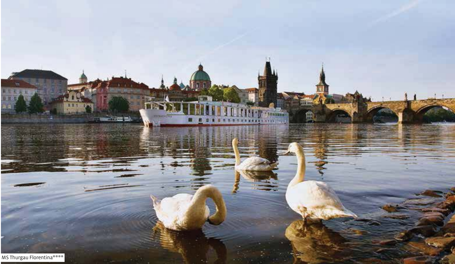
MS Thurgau Florentina****