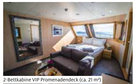
2-Bettkabine VIP Promenadendeck (ca. 21 m 2 )

Das Komfortschiff bietet 35 Gästen grosszügigen Platz. Sämtliche 2-Bett- und 1-Bettkabinen sind mit Dusche/WC, Föhn TV, Minisafe, Klimaanlage sowie Frischluftzufuhr ausgestattet. Auf Ober- und Promenadendeck können die Fenster geöffnet werden, auf dem Hauptdeck sind die kleineren Fenster aus Sicherheitsgründen nicht zu öffnen. Die VIP Kabinen auf dem Promenadendeck (ca. 21 m 2 ) verfügen über einen eigenen Aussenbereich, Doppelbett und eine Sitzcke mit Zweier-Sofa. Die Kabinen auf dem Promenadendeck (ca. 12 m 2 ), Oberdeck (ca. 13 m 2 ) und Oberdeck vorne (ca. 11 m 2 ) sind mit zwei Einzelbetten ausgestattet, auf dem Hauptdeck (ca. 16 m 2 ) mit zwei Einzelbetten oder einem Doppelbett. Die 1-Bettkabine auf dem Hauptdeck ist ca. 11 m 2 gross. Gutbürgerliche lokale und internationale Speisen werden im eleganten Restaurant oder auf dem überdachten Promenadendeck (wetterbedingt) serviert. Zum Entspannen laden die Indoor Lounge und das teilweise überdachte Sonnendeck mit Liegestühlen und Sitzgelegenheiten ein. Gratis WLAN nach Verfügbarkeit. Nichtraucherschiff (Rauchen im gekennzeichneten Aussenbereich erlaubt).