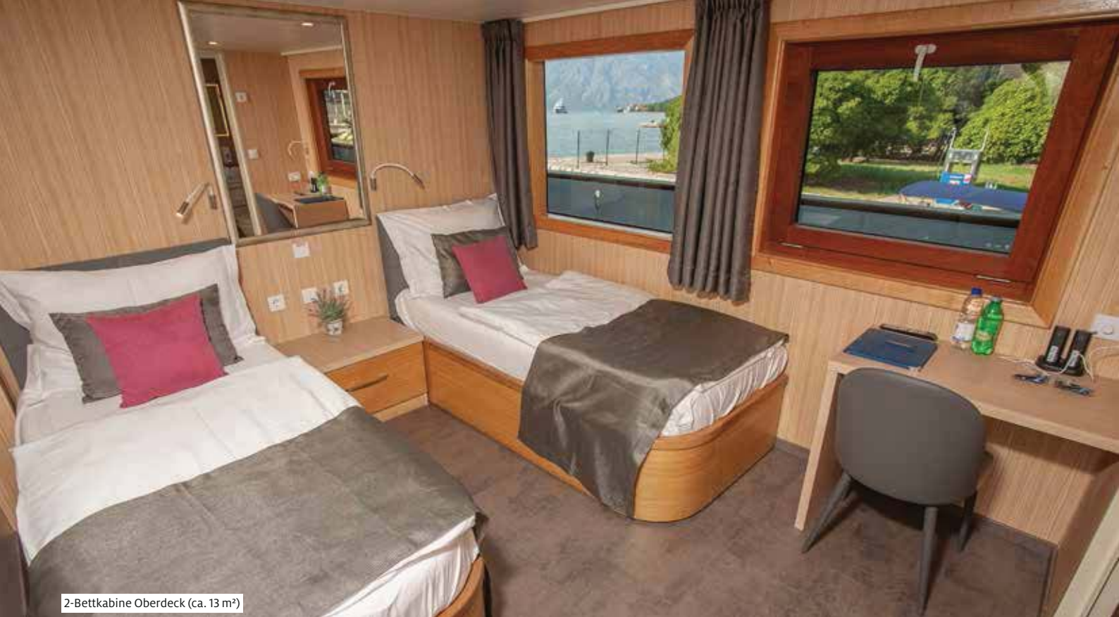
2-Bettkabine Oberdeck (ca. 13 m 2 )