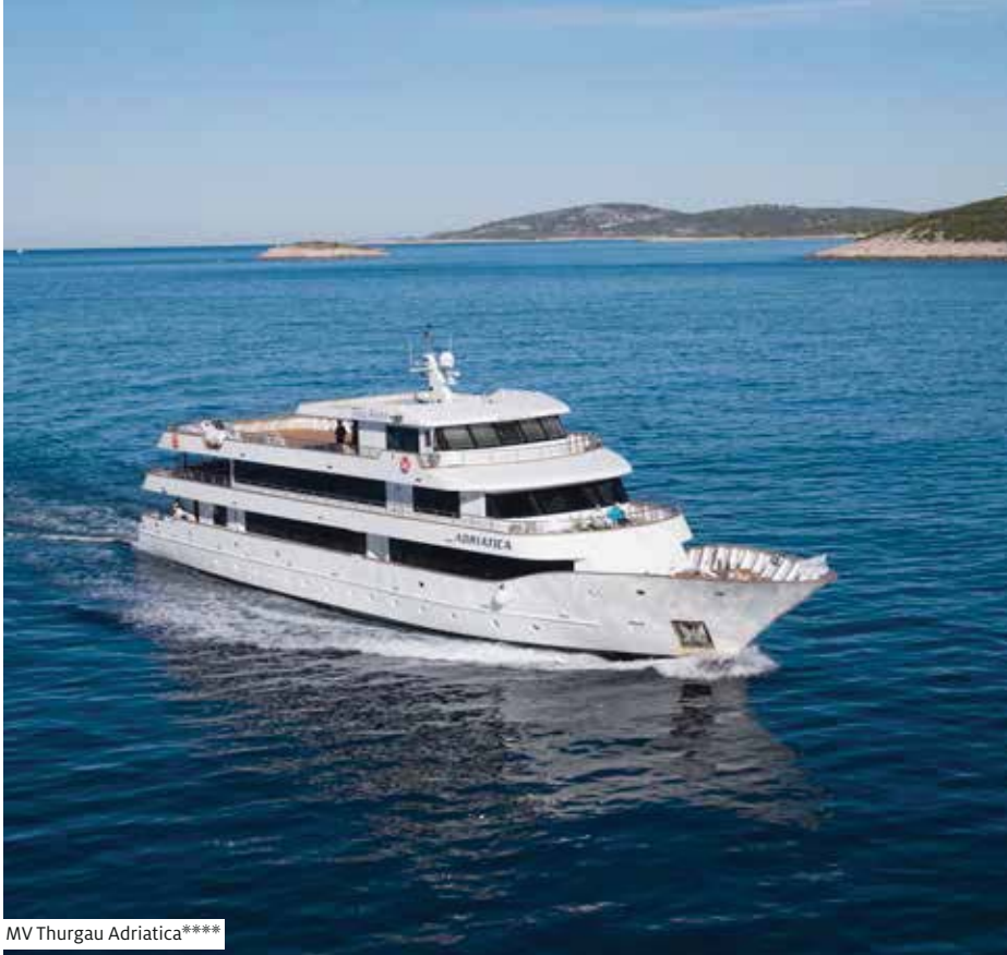
MV Thurgau Adriatica****