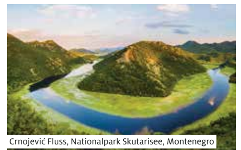
Crnojević Fluss, Nationalpark Skutarisee, Montenegro