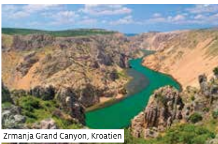
Zrmanja Grand Canyon, Kroatien

Am frühen Morgen Abfahrt Richtung Insel Rab, der grünsten Insel Kroatiens. Nach Ankunft im Hafen von Rab freie Zeit, um das hübsche