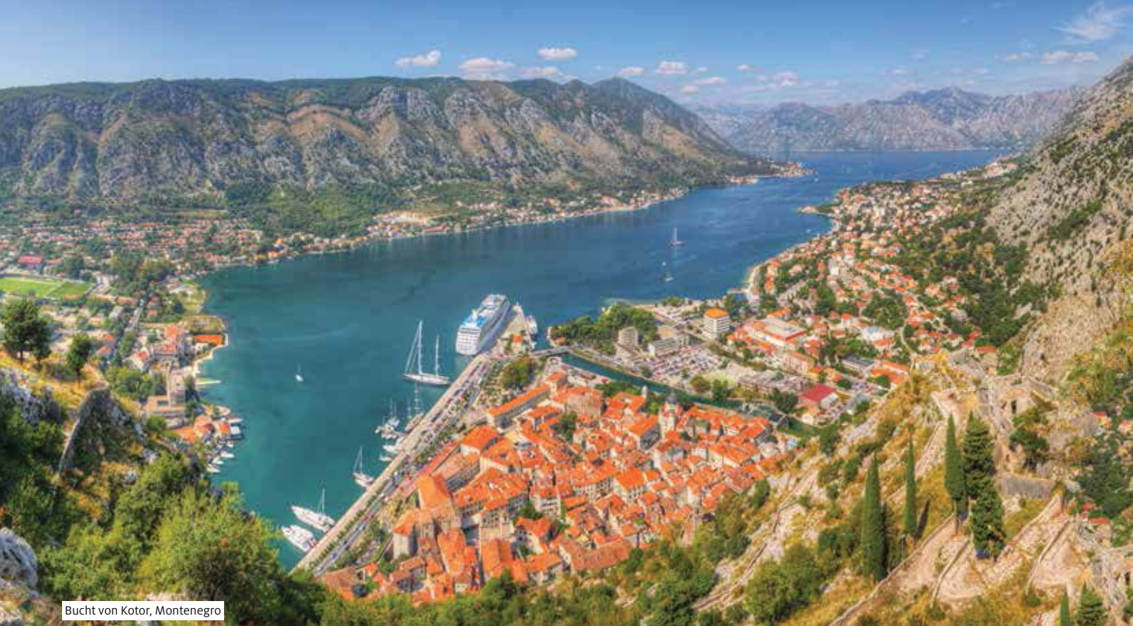
Bucht von Kotor, Montenegro