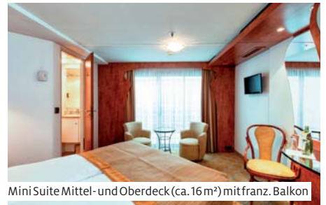
Mini Suite Mittel- und Oberdeck (ca. 16 m 2 ) mit franz. Balkon

Das 2004 gebaute Schiff bietet Platz für 154 Personen. Alle 69 Doppelkabinen (ca. 14 m 2 ) und 7 Mini Suiten (ca. 16 m 2 ) sind aussen liegend, stilvoll eingerichtet und mit Dusche/WC, Föhn, TV, Minibar, Safe und individuell regulierbarer Klimaanlage ausgestattet. Die Kabinen verfügen auf dem Mittel- und Oberdeck über einen französischen Balkon, auf dem Hauptdeck über kleinere, nicht zu öffnende Fenster. Zur Bordausstattung gehören gemütliches Restaurant, Salon mit Tanzfläche, Panorama-Bar, Lido-Bar und Boutique. Ruhe und Entspannung bietet der attraktive Wellnessbereich mit Sauna, Whirlpool, Dampfbad und Solarium. Auf dem Sonnendeck mit Whirlpool und Putting Green laden gemütliche Liegestühle zum Verweilen ein. Lift zwischen Mittel- und Oberdeck. Gratis WLAN nach Verfügbarkeit. Nichtraucherschiff (Rauchen auf dem Sonnendeck erlaubt).