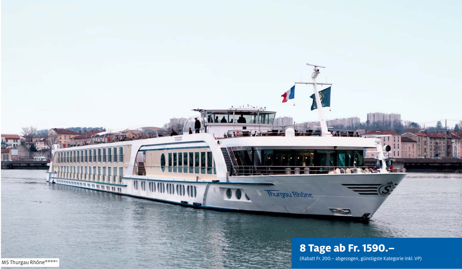
MS Thurgau Rhône*****