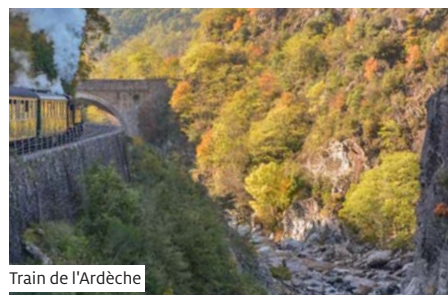
Train de l'Ardèche

Ausschiffung und Busfahrt zum Hauptbahnhof Lausanne. Individuelle Heimreise.