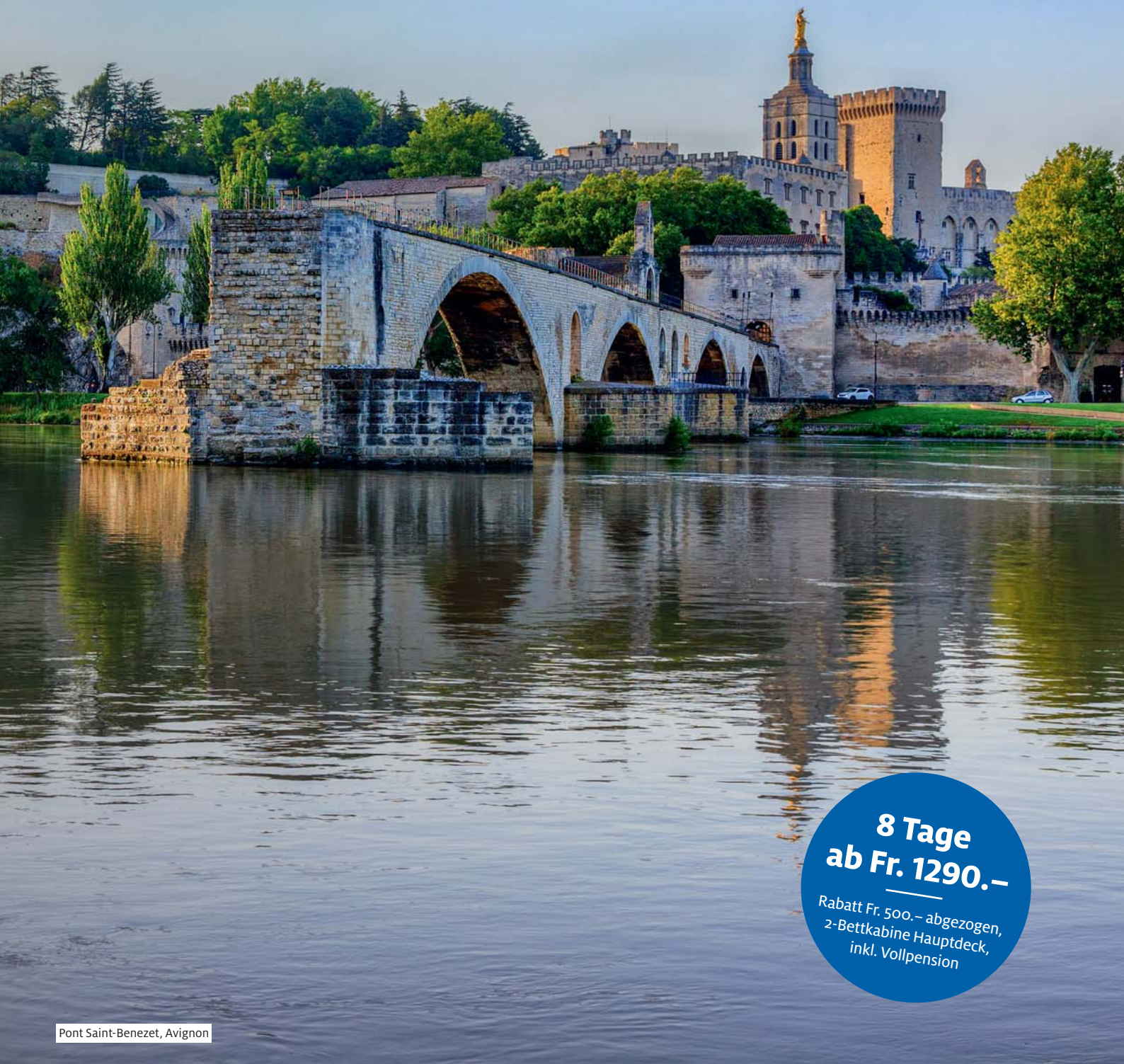
Pont Saint-Benezet, Avignon