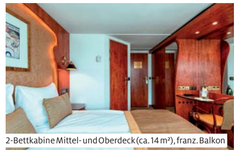
2-Bettkabine Mittel- und Oberdeck (ca. 14 m 2 ), franz. Balkon