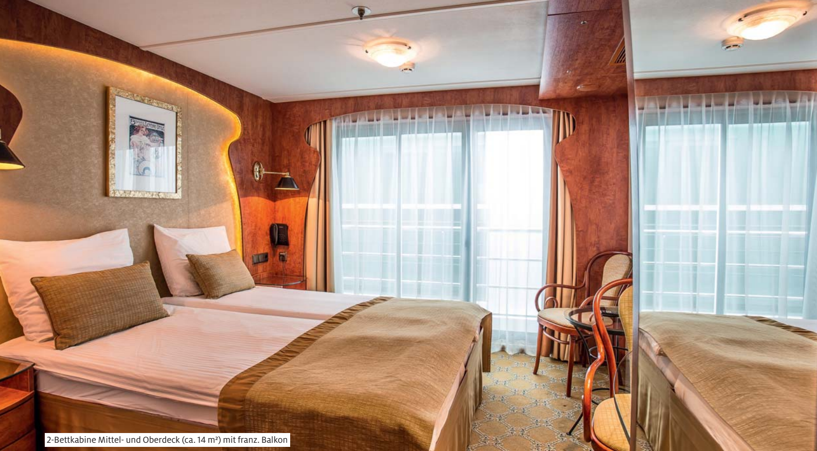
2-Bettkabine Mittel- und Oberdeck (ca. 14 m 2 ) mit franz. Balkon