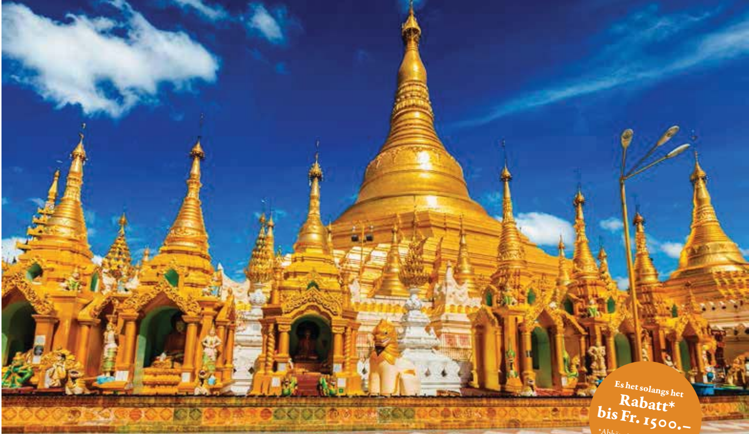
Shwedagon Pagode, Rangun

Es het solangs het Rabatt* bis Fr. 1500.- * Abhängig von Auslastung, Saison, Wechselkurs