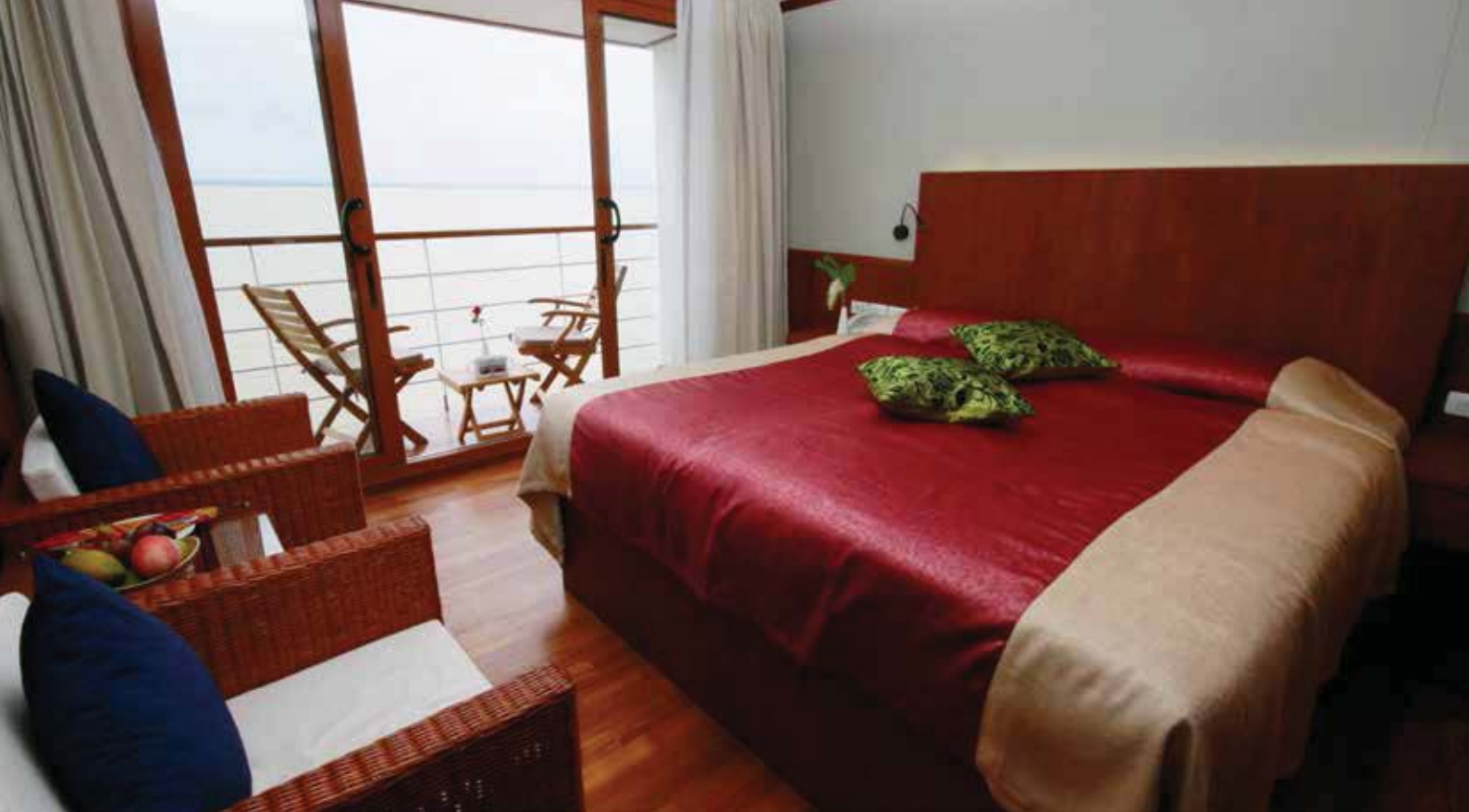
Suite Oberdeck (ca. 24 m 2 ) mit Privatbalkon