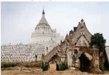
Mya Thein Tan Pagode, Mingun

Spaziergang durch eine burmesische Dorfgemeinde am Flussufer. Weiterfahrt nach Yandabo. Rundgang durch dieses pittoreske Dorf, welches berühmt ist für seine vielen familiär geführten Töpfereien.