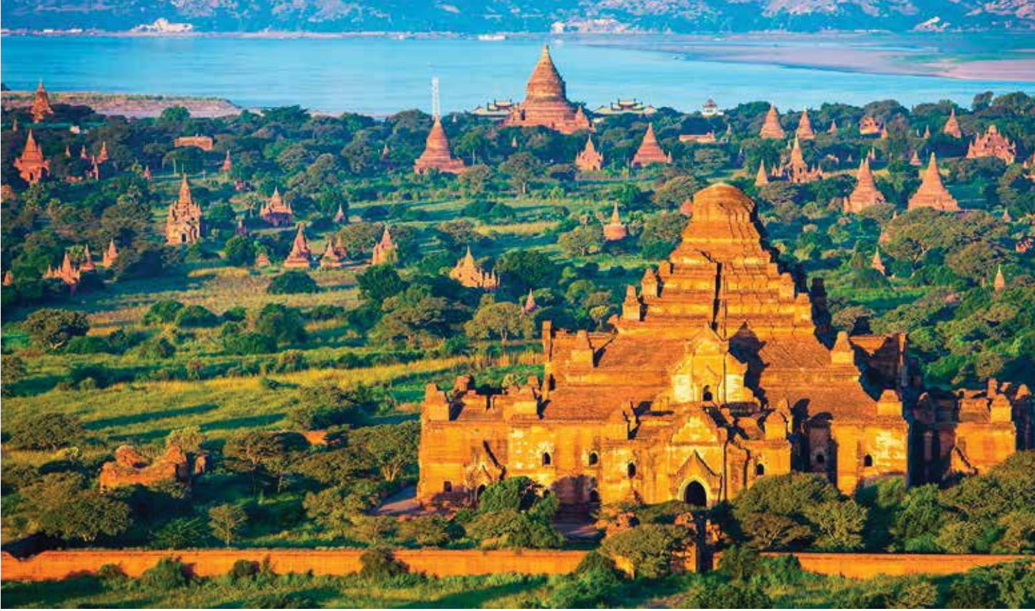
Tempel und Pagoden, Bagan