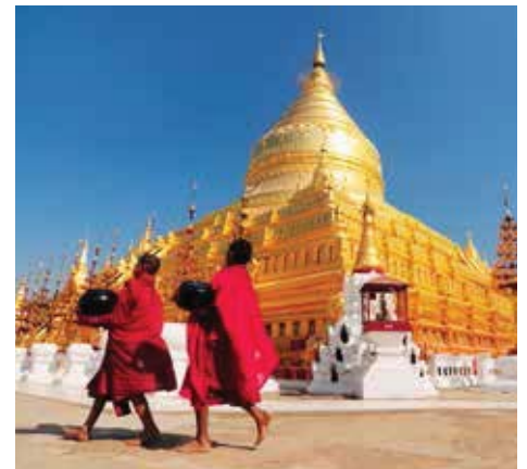
Shwezigon Pagode, Bagan

Links eine Pagode mit glitzerndem, goldenen Dach, rechts ein Tempel aus einheimischem Teakholz gefertigt – was gibt es Schöneres als von der eigenen Suite oder dem gemütlichen Sonnendeck aus die vorüberziehenden Landschaften zu erleben! Goldene Pagoden, beeindruckende Tempel, Rikschas und Pferdekutschen, farbige Märkte und freundliche Leute prägen das faszinierende Land und diese aussergewöhnlichen Reisen auf dem Irrawaddy. Zu den Highlights dieser Reisen gehören die abwechslungsreichen Programme mit Rundfahrten in Mandalay, Bagan und Rangun, der unvergessliche Sonnenuntergang an der U Bein Brücke, aber auch die Besuche von ursprünglichen Dörfern und der Ruinenstadt Ava. Einblicke in die burmesische Kultur bieten ausserdem die Besuche einer Töpferei, einer Eisen schmiede und einer Zigarren-Manufaktur sowie die Aufführungen von burmesischen Tänzen und das Puppentheater an Bord einer unserer beliebten Thurgau Exotic Schiffen. Sie haben die Qual der Wahl!