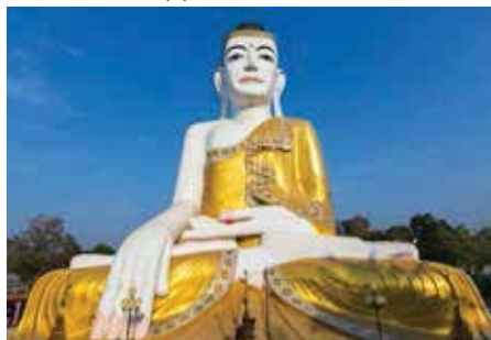
Sitzender Buddha, Pyay

Gleiche Reise in umgekehrter Reihenfolge.