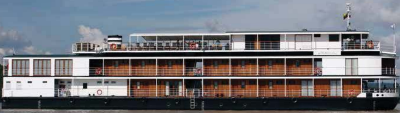
RV Thurgau Exotic 3****