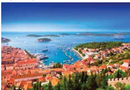
Hvar, Insel Hvar, Kroatien

Am Morgen Weiterfahrt Richtung Montenegro. Fahrt durch die berühmte Bucht von Kotor, die zum UNESCO-Welterbe gehört. Nach Ankunft in Kotor am späteren Nachmittag, Stadtrundgang mit St. Triphons-Kathedrale. Zeit zur freien Verfügung und individuelles Abendessen in Kotor. (F, M)