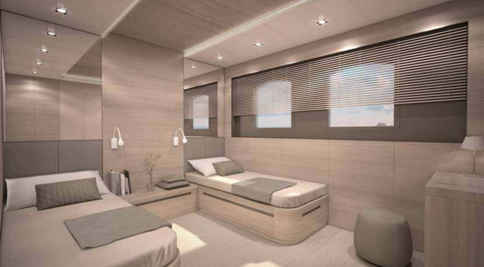
2-Bettkabine Oberdeck (ca. 13 m 2 ), Illustrationsbild