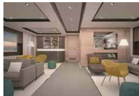
Indoor Lounge, Illustrationsbild