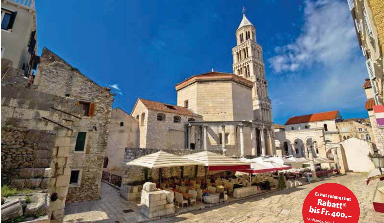
Diokletianpalast Split, Kroatien

Es het solangs het Rabatt* bis Fr. 400.- *Abhängig von Auslastung, Saison, Wechselkurs