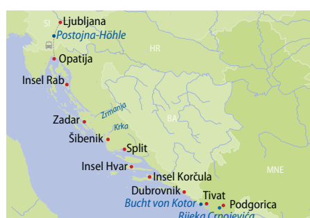
Zrmanja Grand Canyon, Kroatien

Schifffahrt bis zum Mittag Richtung Split. Nach dem Mittagessen geführter Stadtrundgang mit Besuch des Diokletianpalastes. Zeit zur freien Verfügung und individuelles Abendessen in einem der zahlreichen Restaurants. (F, M)