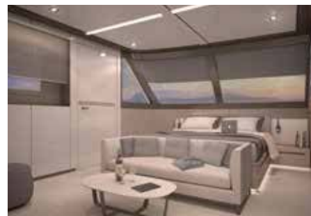
2-Bettkabine VIP Promenadendeck (ca. 21 m 2 ), Illustrationsbild

Das neue yachtähnliche Komfortschiff, welches 2018 in Betrieb genommen wird, bietet 36 Gästen grosszügigen Platz. Sämtliche 2-Bett- und Einzelkabinen sind mit Dusche/WC, Föhn TV, Minisafe, Klimaanlage sowie extra Frischluftzufuhr ausgestattet. Auf Ober- und Promenadendeck können die Fenster geöffnet werden, auf dem Hauptdeck sind die kleineren Fenster aus Sicherheitsgründen nicht zu öffnen. Die VIP Kabinen auf dem Promenadendeck (ca. 21 m 2 ) verfügen über privaten Aussenbereich, Doppelbett und eine Sitzcke mit Zweier-Sofa. Die Kabinen auf dem Promenadendeck (ca. 12 m 2 ) und dem Oberdeck (ca. 13 m 2 ) sind mit zwei Einzelbetten, auf dem Oberdeck vorne (ca. 11 m 2 ) mit einem Doppelbett, auf dem Hauptdeck (ca. 16 m 2 ) mit zwei Einzelbetten oder einem Doppelbett ausgestattet. Die Einzelkabinen auf dem Promenaden- und Hauptdeck sind ca. 8 m 2 bzw. ca. 11 m 2 gross. Lokale und internationale Speisen werden im eleganten Restaurant oder auf dem überdachten Promenadendeck serviert. Zum Entspannen laden die Indoor Lounge und das teilweise überdachte Sonnendeck mit Liegestühlen und Sitzgelegenheiten ein. Gratis WLAN nach Verfügbarkeit. Nichtraucherschiff (Rauchen im gekennzeichneten Aussenbereich erlaubt).