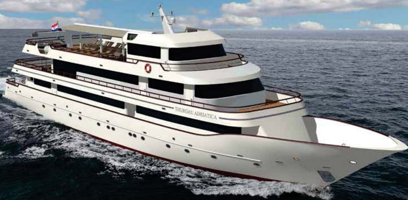
MV Thurgau Adriatica****

Rabatt Fr. 400.- abgezogen, HD hinten, (ohne Flug)