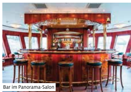
Bar im Panorama-Salon