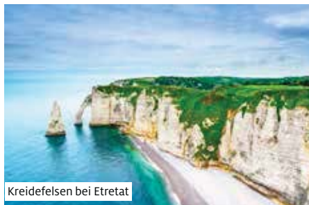
Kreidefelsen bei Etrétat

Ausschiffung und Rückfahrt im TGV nach Basel und Weiterfahrt zu Ihrem Wohnort.