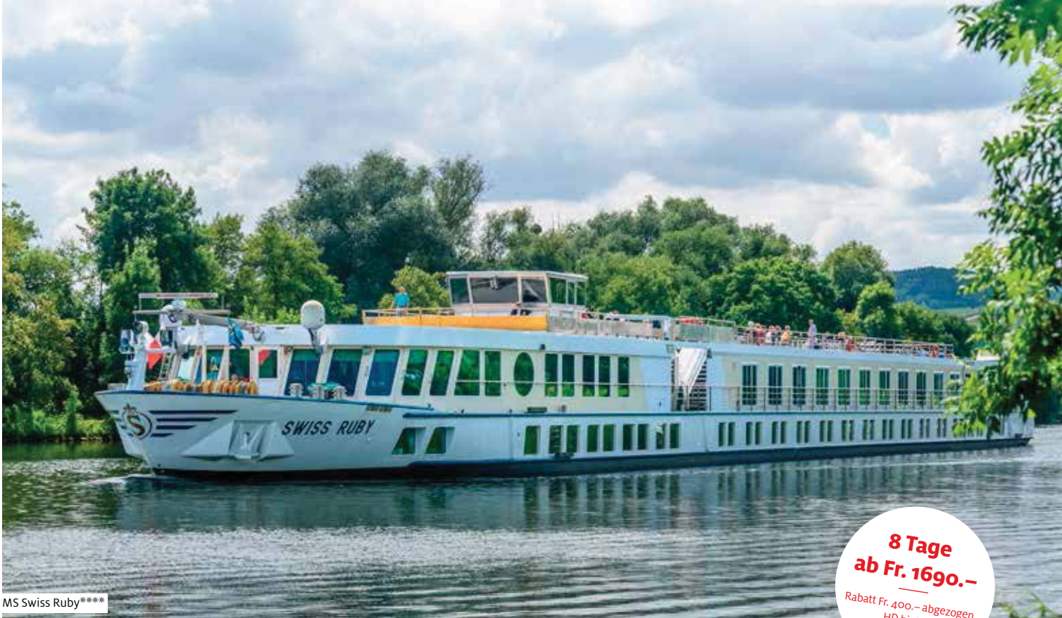
MS Swiss Ruby****

8 Tage ab Fr. 1690.- Rabatt Fr. 400.- abgezogen, HD hinten, Vollpension