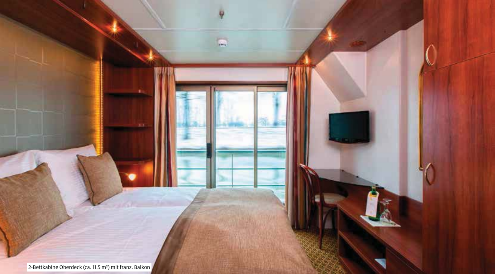
2-Bettkabine Oberdeck (ca. 11.5 m²) mit franz. Balkon