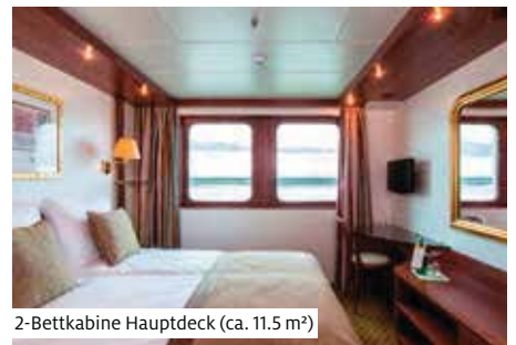
2-Bettkabine Hauptdeck (ca. 11.5 m²)

Das unter Schweizer Flagge fahrende Schiff erfreut sich dank seines luxuriösen Interieurs grosser Beliebtheit. Die 44 Aussenkabinen bieten Platz für 88 Gäste. Alle Kabinen haben eine Grösse von ca. 11.5 m² und sind mit zwei Betten, Dusche/WC, Föhn, Minibar, Safe, TV, Radio und individuell regulierbarer Klimaanlage ausgestattet. Auf dem Oberdeck haben die Kabinen französische Balkone, auf dem Hauptdeck lassen sich die Fenster nicht öffnen. In den Hauptdeckkabinen können die Betten auf Wunsch etwas auseinander gestellt werden. Zur Bordausstattung gehören Salon mit Tanzfläche und Panorama-Bar, grosszügiges Restaurant, kleine Bordboutique und teilweise überdachtes Sonnendeck. Gratis WLAN nach Verfügbarkeit. Nichtraucherschiff (Rauchen auf dem Sonnendeck erlaubt).