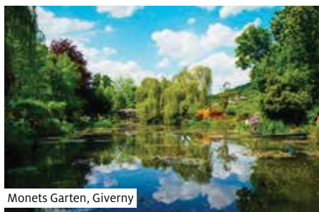
Monets Garten, Giverny

Gleiche Reise in umgekehrter Reihenfolge.