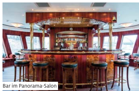
Bar im Panorama-Salon