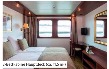
2-Bettkabine Hauptdeck (ca. 11.5 m 2 )

Das unter Schweizer Flagge fahrende Schiff erfreut sich dank seines luxuriösen Interieurs grosser Beliebtheit. Die 44 Aussenkabinen bieten Platz für 88 Gäste. Alle Kabinen haben eine Grösse von ca. 11.5 m 2 und sind mit zwei Betten, Dusche/WC, Föhn, Minibar, Safe, TV, Radio und individuell regulierbarer Klimaanlage ausgestattet. Auf dem Oberdeck haben die Kabinen einen französischen Balkon, auf dem Hauptdeck lassen sich die Fenster nicht öffnen. In den Hauptdeckkabinen können die Betten auf Wunsch etwas auseinander gestellt werden. Zur Bordausstattung gehören Tanzfläche und Panorama-Bar, grosszügiges Restaurant, kleine Bordboutique und teilweise überdachtes Sonnendeck. Gratis WLAN nach Verfügbarkeit. Nichtraucherschiff (Rauchen auf dem Sonnendeck erlaubt).