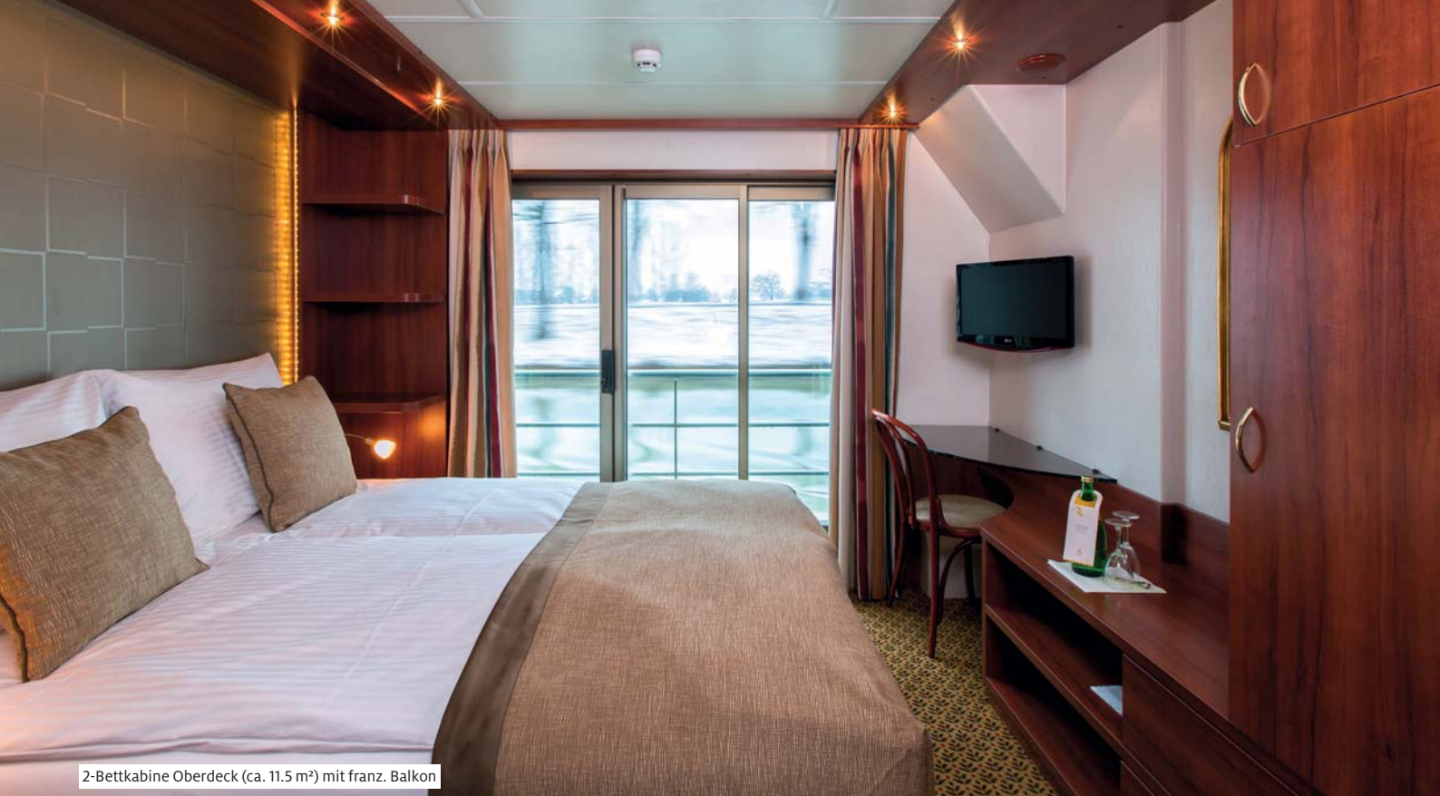
2-Bettkabine Oberdeck (ca. 11.5 m 2 ) mit franz. Balkon