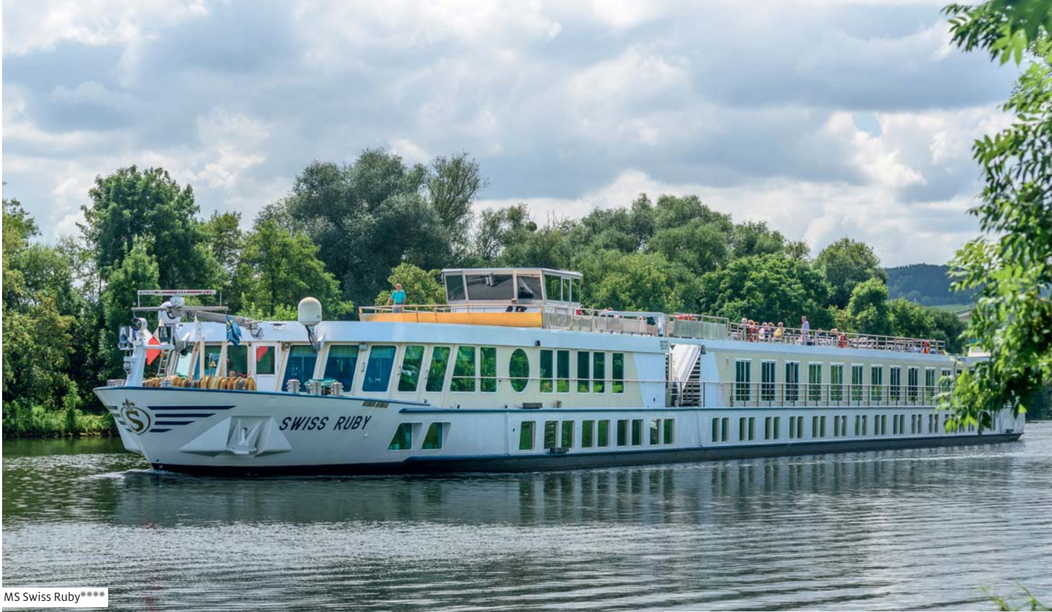
MS Swiss Ruby****