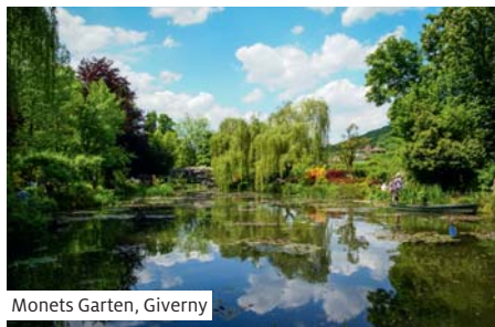
Monets Garten, Giverny

Gleiche Reise in umgekehrter Reihenfolge mit kleinen Änderungen.