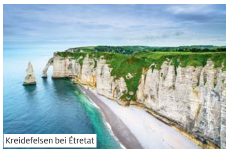
Kreidefelsen bei Étretat

Ausschiffung und Rückfahrt im TGV nach Basel und Weiterfahrt zu Ihrem Wohnort.