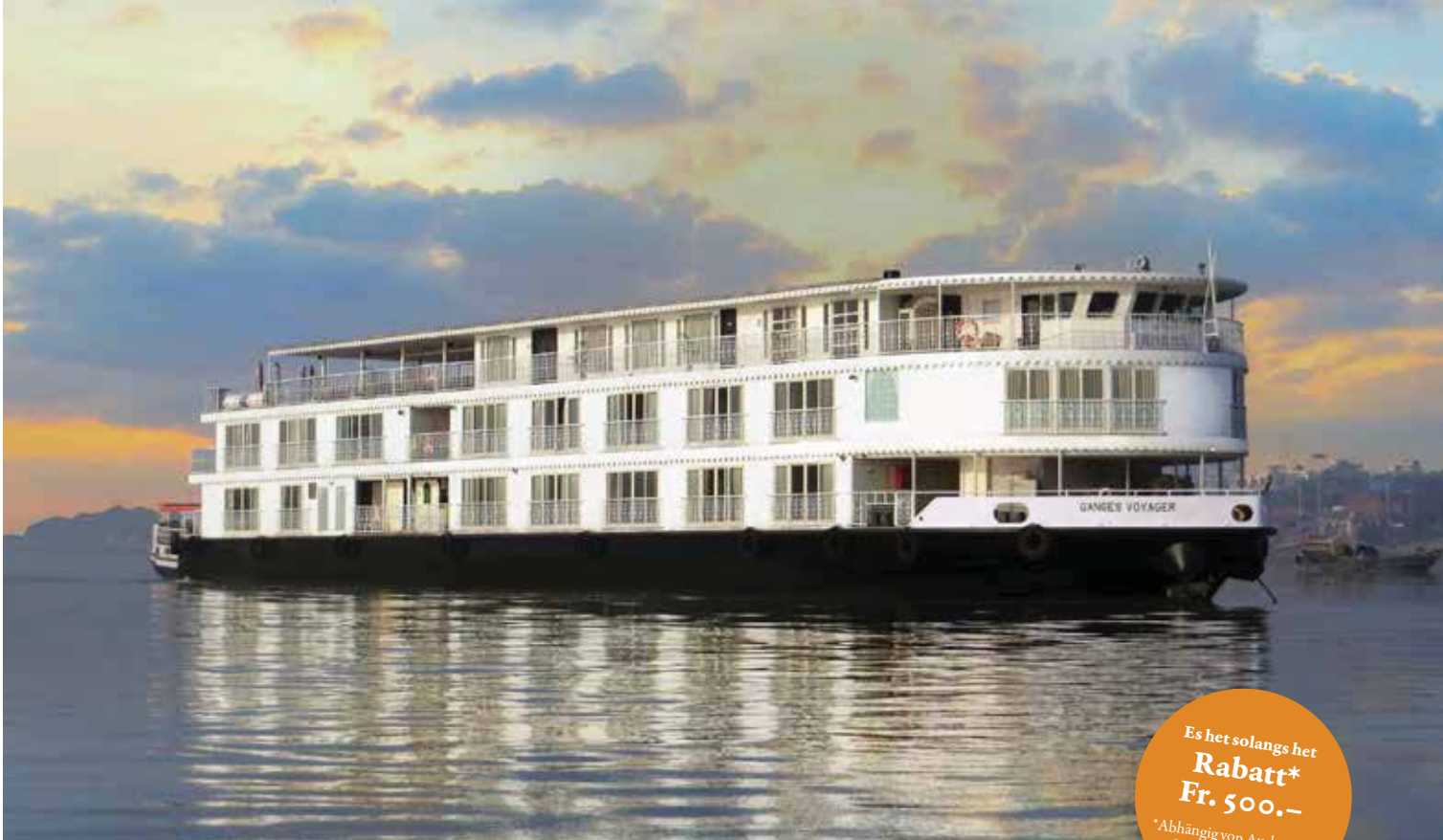
RV Ganges Voyager I*****

Es het solangs het Rabatt* Fr. 500.- * Abhängig von Auslastung, Saison, Wechselkurs