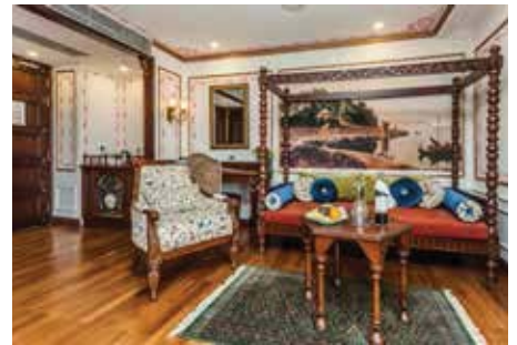
Wohnbereich Viceroy Suite (33 m 2 ), franz. Balkon

Das 2015 gebaute Luxussschiff bietet Platz für 56 Gäste. Mit der exquisiten Ausstattung bietet es jeglichen Komfort eines Fünf-Sterne-Hotels. Alle Suiten verfügen über Bad mit Dusche/WC, Föhn, Bademäntel und Hausschuhe, Wecker, Safe, TV, Minibar, individuell regulierbare Klimaanlage und französischen Balkon. Die Signature und Colonial Suiten (ca. 24 m 2 ) sind mit einem Queen-Size-Bett ausgestattet, welches auch getrennt als Einzelbetten gestellt werden kann. Die Heritage Suiten (ca. 26 m 2 ), Viceroy Suiten (ca. 33 m 2 ) und Maharaja Suite (ca. 37 m 2 ) verfügen über ein King-Size-Bett. Die Maharaja Suite hat zusätzlich eine Badewanne. Im Restaurant werden sowohl lokale als auch internationale Speisen serviert. Auf dem teils überdachten Sonnendeck befinden sich eine klimatisierte Lounge mit Bar, eine Outdoor Lounge, Spa und Fitnesscenter. Gratis WLAN nach Verfügbarkeit auf dem Sonnendeck und in der Lounge. Nichtraucher Schiff (Rauchen an den dafür vorgesehenen Plätzen erlaubt).