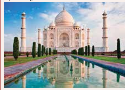
Taj Mahal, Agra

Nach dem Frühstück Transfer zum Flughafen Delhi. Rückflug via Dubai nach Zürich. Individuelle Heimreise.