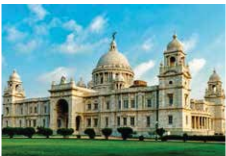
Victoria Memorial, Kalkutta

Nach dem Frühstück Ausschiffung und Transfer zum Flughafen Kalkutta. Rückflug via Dubai nach Zürich. Individuelle Heimreise.