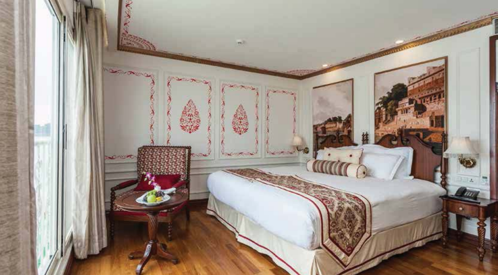
Colonial-Suite (24 m 2 ), franz. Balkon