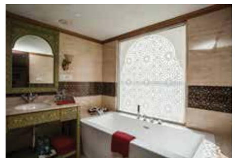
Bad, Maharaja Suite