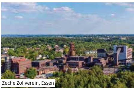
Zeche Zollverein, Essen

Morgens Ausflug (1) zum Keukenhof mit seiner einmaligen Blütenpracht (gilt für die