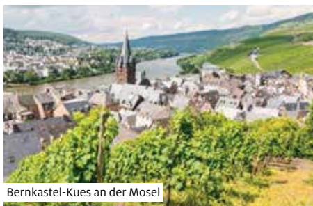
Bernkastel-Kues an der Mosel

Rundgang (1) durch die bezaubernde Altstadt Bernkastels mit ihren zahlreichen Fachwerkhäusern und wunderschönem Marktplatz.