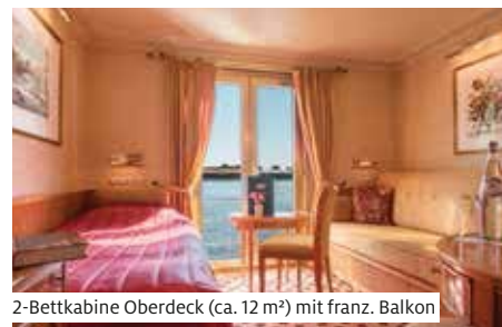
2-Bettkabine Oberdeck (ca. 12 m 2 ) mit franz. Balkon

Dieses Schiff bietet ein stilvolles Ambiente und Platz für 96 Gäste. Die Kabinen (ca. 12 m 2 ) verfügen über ein Doppelbett mit zwei Matratzen oder ein Sofabett sowie ein getrennt stehendes Bett. Die Deluxe Kabinen sind etwas grösser (ca. 16 m 2 ) und verfügen über ein Doppelbett mit zwei Matratzen. Alle Kabinen sind mit Dusche/WC, Föhn, Minibar, Safe, TV, Bordtelefon und individuell regulierbarer Klimaanlage ausgestattet. Sämtliche Kabinen des Oberdecks haben einen französischen Balkon. Im gemütlichen Panorama-Restaurant werden internationale Spezialitäten und deutsche Gerichte zu einer Tischzeit serviert. Zur Bordausrüstung gehören Réception, Souvenir-Shop und Panorama-Salon mit Bar. Das Sonnendeck mit Sonnensegel, Liegestühlen, Stühlen und Tischen lädt zum Verweilen ein. WLAN nach Verfügbarkeit (gegen Gebühr). Nichtraucherschiff (Rauchen auf dem Sonnendeck erlaubt).