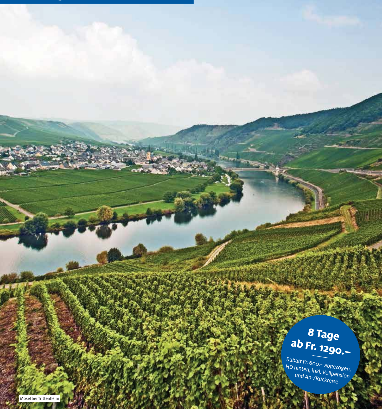
Mosel bei Trittenheim