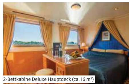
2-Bettkabine Deluxe Hauptdeck (ca. 16 m 2 )