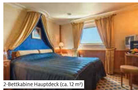
2-Bettkabine Hauptdeck (ca. 12 m 2 )