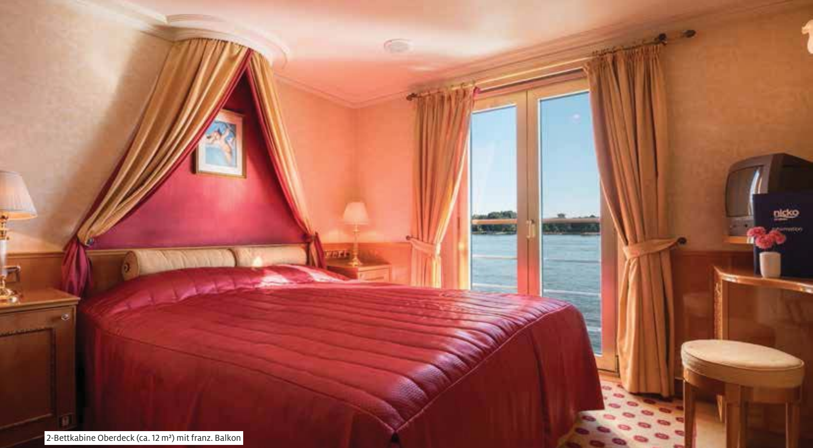
2-Bettkabine Oberdeck (ca. 12 m 2 ) mit franz. Balkon