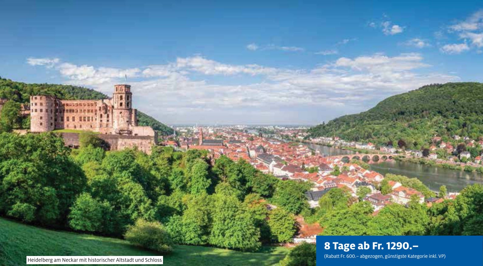
Heidelberg am Neckar mit historischer Altstadt und Schloss