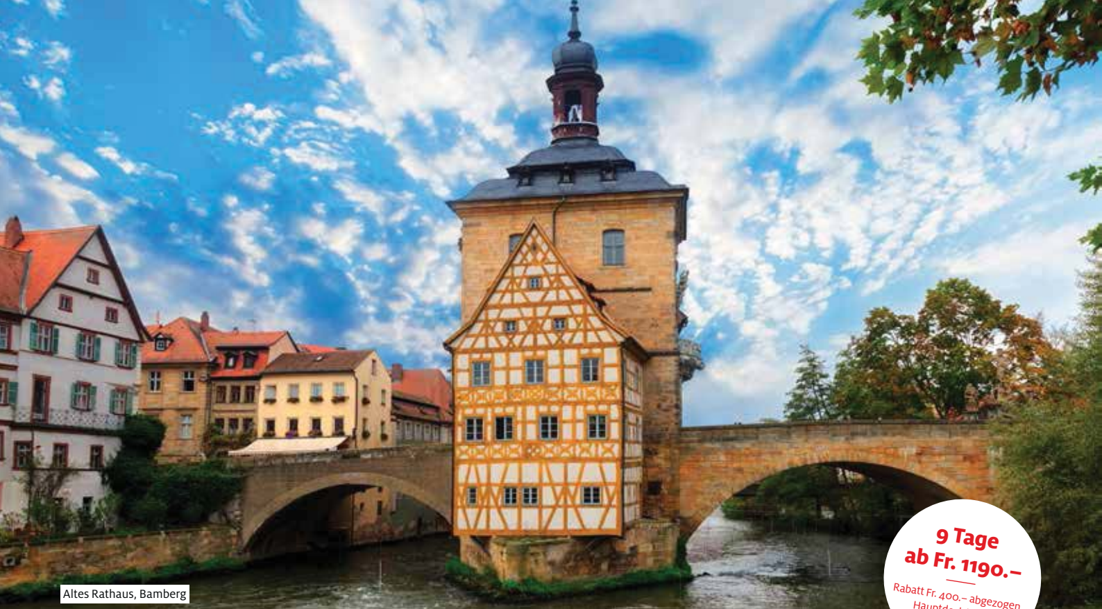
Altes Rathaus, Bamberg

9 Tage ab Fr. 1190.- — Rabatt Fr. 400.- abgezogen, Hauptdeck hinten, Vollpension