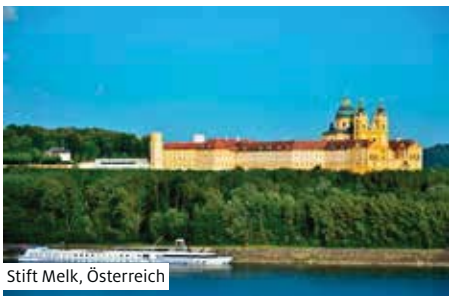
Stift Melk, Österreich

Rundfahrt/-gang (1) durch die Hauptstadt Ungarns mit ihren imposanten Bauwerken. Am Nachmittag stehen ein Spaziergang (2) durch Bu-