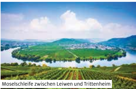
Moselschleife zwischen Leiwen und Trittenheim

Eindrucksvolle Fahrt nach Remich. Ausflug (1) nach Luxemburg. Als eines der EU-Gründungsmitglieder ist Luxemburg auch Verwaltungssitz und Tagungsort von zahlreichen Institutionen. Während des Abendessens fährt das Schiff bis zur französischen Grenze bevor es wendet und Kurs moselabwärts Richtung Trier aufnimmt.