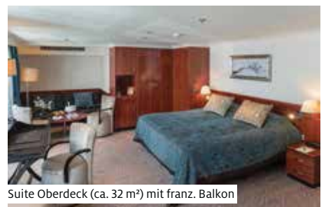
Suite Oberdeck (ca. 32 m 2 ) mit franz. Balkon