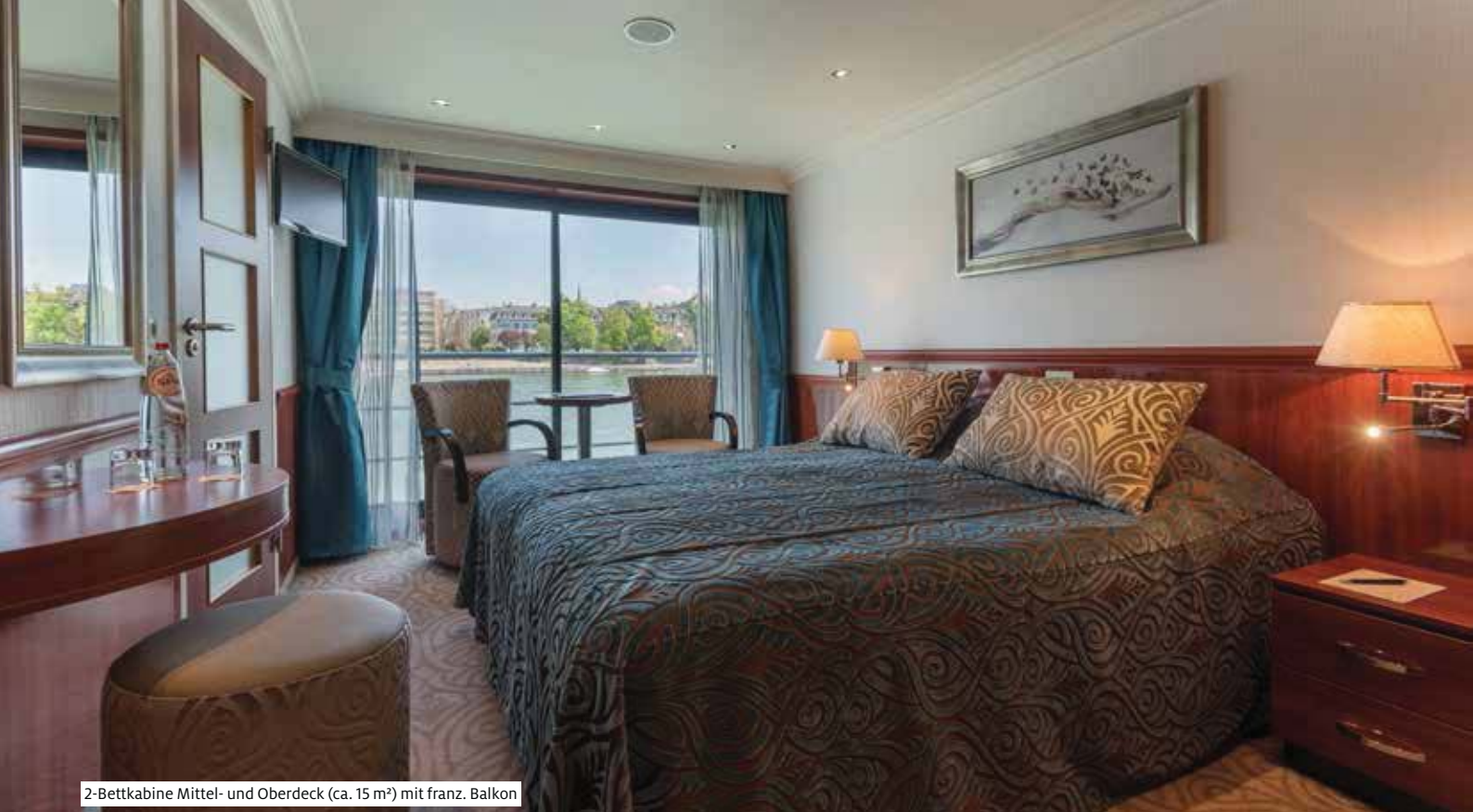
2-Bettkabine Mittel- und Oberdeck (ca. 15 m 2 ) mit franz. Balkon