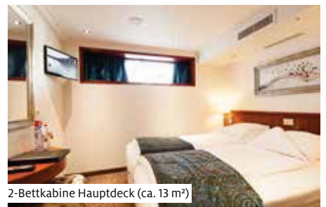
2-Bettkabine Hauptdeck (ca. 13 m 2 )

Dieses 2012 erbaute Luxussschiff bietet Platz für 141 Gäste in 69 Kabinen und einer Suite (ca. 32 m 2 ). Die komfortablen Kabinen sind mit Dusche/WC, Föhn, Safe, Telefon, TV/Radio und individuell regulierbarer Klimaanlage ausgestattet. Die Kabinen auf dem Mittel- und Oberdeck (ca. 15 m 2 ) verfügen zusätzlich über einen Tisch und zwei Sessel sowie über einen französischen Balkon. Die Kabinen der Kategorie Mitteldeck hinten sind etwas kleiner, ohne Stühle und Tisch ausgestattet. Zudem sind die Betten durch einen Nachttisch getrennt. Auf dem Hauptdeck (ca. 13 m 2 ) haben die Kabinen kleinere, nicht zu öffnende Fenster. Zur Bordausstattung gehören Foyer mit Réception, Shop, grosszügiges Restaurant, grosser Panorama-Salon mit Tanzfläche und Bar, Captains Corner sowie Sauna- und Fitnessbereich. Das Sonnendeck mit Whirlpool, Liegestühlen und Sonnenschirmen lädt zum Verweilen ein. Gratis WLAN nach Verfügbarkeit. Lift zwischen Mittel- und Oberdeck. Nichtraucher Schiff (Rauchen auf dem Sonnendeck erlaubt).