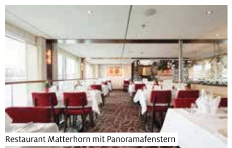
Restaurant Matterhorn mit Panoramafenstern