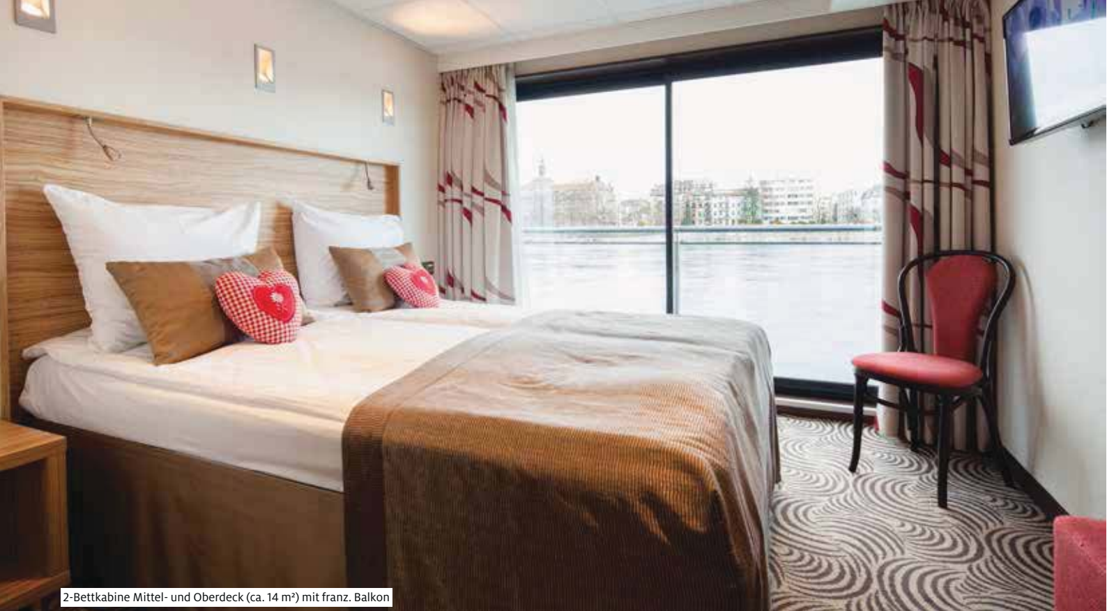
2-Bettkabine Mittel- und Oberdeck (ca. 14 m 2 ) mit franz. Balkon