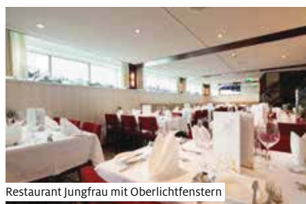
Restaurant Jungfrau mit Oberlichtfenstern