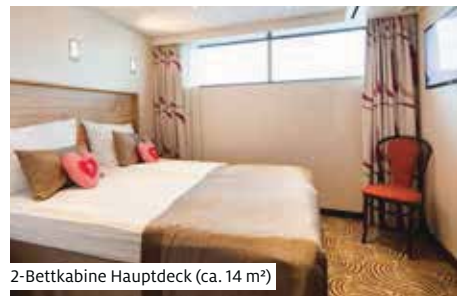
2-Bettkabine Hauptdeck (ca. 14 m 2 )

Das luxuriöse Schiff der Scylla-Flotte nahm 2013 seinen Dienst auf. In 90 Kabinen finden bis zu 180 Personen Platz. Die grosszügigen, modernen Kabinen (ca. 14 m 2 ) sind mit Dusche/WC, Föhn, Minibar, Safe, TV/Radio und individuell regulierbarer Klimaanlage ausgestattet. Auf dem Mittel- und Oberdeck verfügen die Kabinen über französische Balkone. Die Fenster der Kabinen auf dem Hauptdeck lassen sich nicht öffnen. Die Gäste des Haupt- und Mitteldecks speisen im Restaurant Jungfrau mit Oberlichtfenstern, die Gäste des Oberdecks im Restaurant Matterhorn mit Panoramafenstern. Alternativ dazu gibt es mittags einen «Lightlunch» (Buffet) im Panorama-Salon. Zur Bordausstattung gehören Réception, stilvoll eingerichteter Panorama-Salon mit Bar, komfortable Lido-Bar mit Aussenterrasse und Schiffsboutique. Das grosse Sonnendeck bietet Putting Green, kleinen Pool, kleine Aussichtsterrasse am Bug sowie Schattenplätze mit Liegestühlen und Sitzgruppen. Gratis WLAN nach Verfügbarkeit. Lift zwischen Haupt- und Oberdeck. Nichtraucher Schiff (Rauchen auf dem Sonnendeck erlaubt).