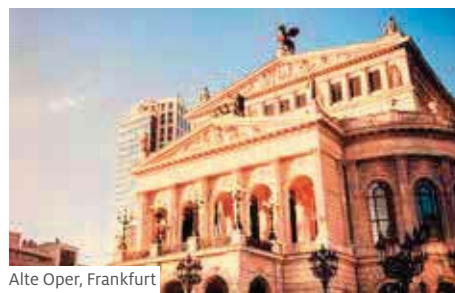
Alte Oper, Frankfurt