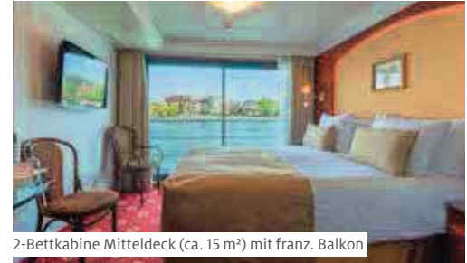
2-Bettkabine Mitteldeck (ca. 15 m²) mit franz. Balkon