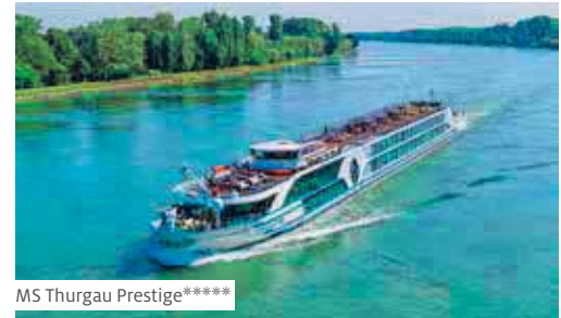
MS Thurgau Prestige*****