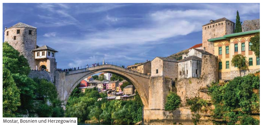
Mostar, Bosnien und Herzegowina