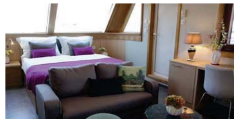
2-Bett VIP Promenadendeck (ca. 21 m²), eigener Aussenbereich