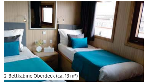
2-Bettkabine Oberdeck (ca. 13 m 2 )