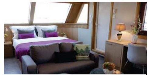
2-Bett VIP Promenadendeck (ca. 21 m 2 ), eigener Aussenbereich