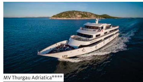
MV Thurgau Adriatica****