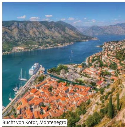
Bucht von Kotor, Montenegro

Gleiche Reise in umgekehrter Reihenfolge, ohne Übernachtung auf der Insel Mljet.