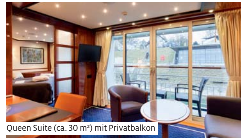
Queen Suite (ca. 30 m 2 ) mit Privatbalkon