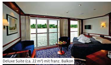
Deluxe Suite (ca. 22 m²) mit franz. Balkon