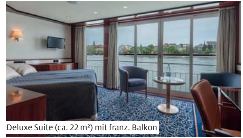
Deluxe Suite (ca. 22 m 2 ) mit franz. Balkon