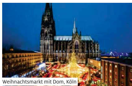
Weihnachtsmarkt mit Dom, Köln

Ausschiffung nach dem Frühstück und individuelle Heimreise.