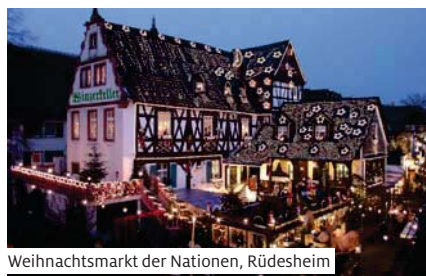
Weihnachtsmarkt der Nationen, Rüdesheim