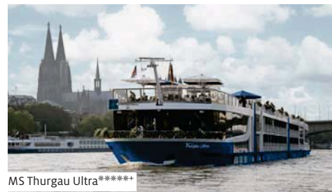
MS Thurgau Ultra*****