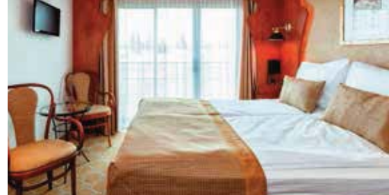
2-Bettkabine Mittel- und Oberdeck (ca. 14 m 2 ) mit franz. Balkon