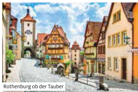
Rothenburg ob der Tauber

Wegen niedrigen Brückenhöhen kann das Sonnendeck zwischen Kelheim und Frankfurt nur wenig genutzt werden.