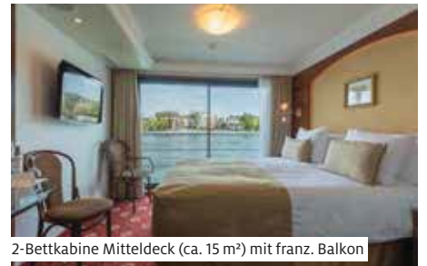
2-Bettkabine Mitteldeck (ca. 15 m 2 ) mit franz. Balkon

Auf dem beliebten Luxussschiff finden 124 Passagiere in 41 Kabinen (ca. 15 m 2 ), 7 Junior Suiten (ca. 19 m 2 ) und 14 Master Suiten (ca. 30 m 2 ) Platz. Alle Kabinen und Suiten sind mit Dusche/WC, TV/Radio, Safe, Föhn, Telefon, individuell regulierbarer Klimaanlage sowie Tisch und Stuhl ausgestattet. Zusätzlich verfügen die Junior Suiten über zwei bequeme Sessel und die Master Suiten über Sofa, Hocker, begehbares Schrank und Badewanne. Die Kabinen auf Mittel- und Oberdeck haben einen französischen Balkon. Auf dem Hauptdeck können die Fenster nicht geöffnet werden. Zur Bordausstattung gehören grosszügiges Restaurant, Panorama-Salon mit Tanzfläche und Bar, Réception, Boutique, Bistro mit Internet-Corner, Fitnessraum, Massagesalon, grosses Sonnendeck mit Whirlpool. Gratis WLAN nach Verfügbarkeit. Lift zwischen Mittel- und Oberdeck. Nichtraucher-schiff (Rauchen auf dem Sonnendeck erlaubt).