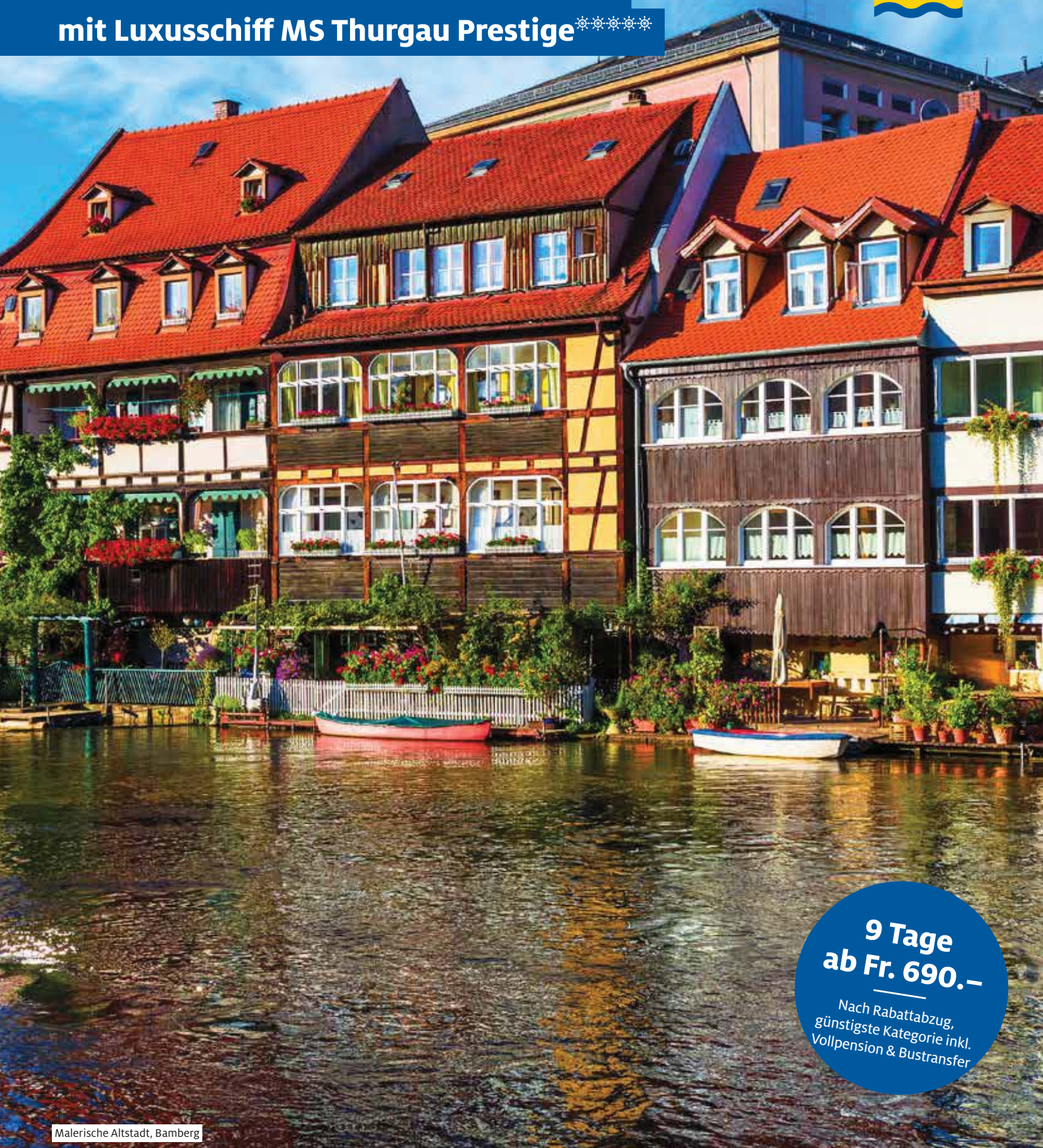
Malerische Altstadt, Bamberg

9 Tage ab Fr. 690.- Nach Rabattabzug, günstigste Kategorie inkl. Vollpension & Bustransfer