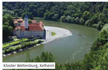
Kloster Weltenburg, Kelheim