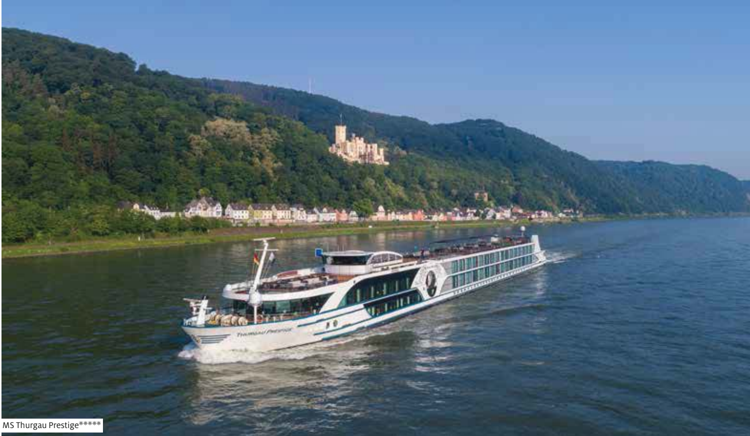
MS Thurgau Prestige*****