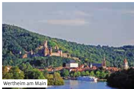
Wertheim am Main