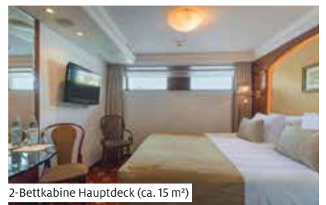
2-Bettkabine Hauptdeck (ca. 15 m 2 )