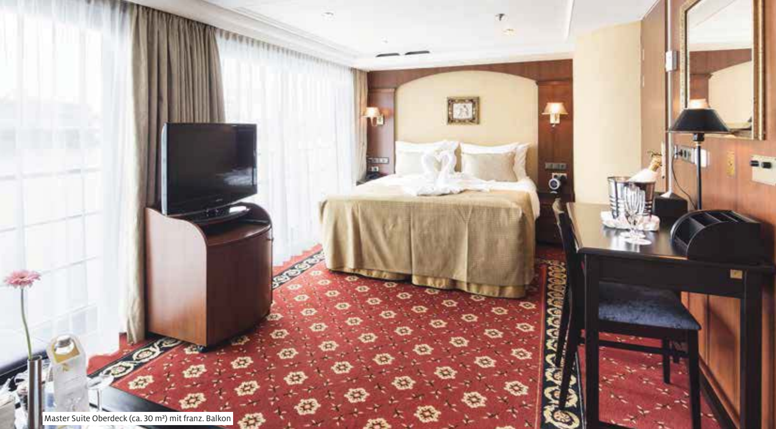
Master Suite Oberdeck (ca. 30 m 2 ) mit franz. Balkon