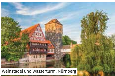
Weinstadel und Wasserturm, Nürnberg

Ausschiffung nach dem Frühstück und individuelle Heimreise.