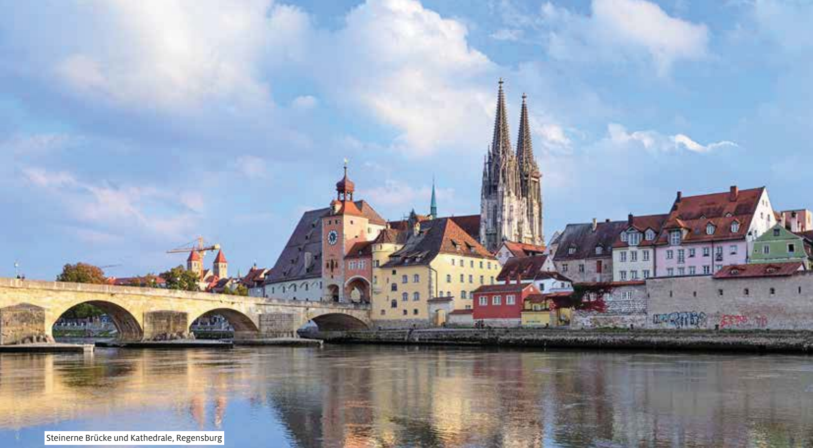
Steinerne Brücke und Kathedrale, Regensburg