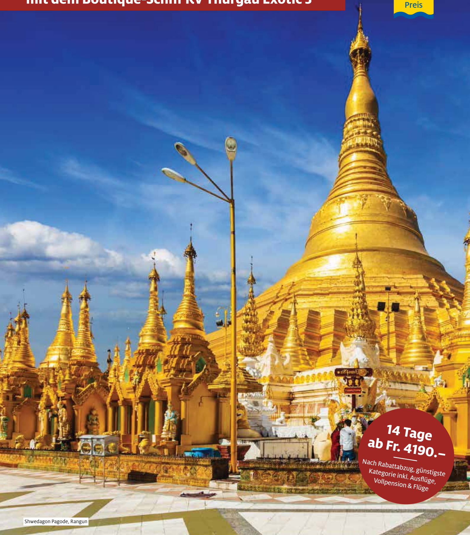
Shwedagon Pagode, Rangun