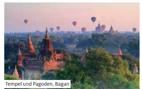
Tempel und Pagoden, Bagan