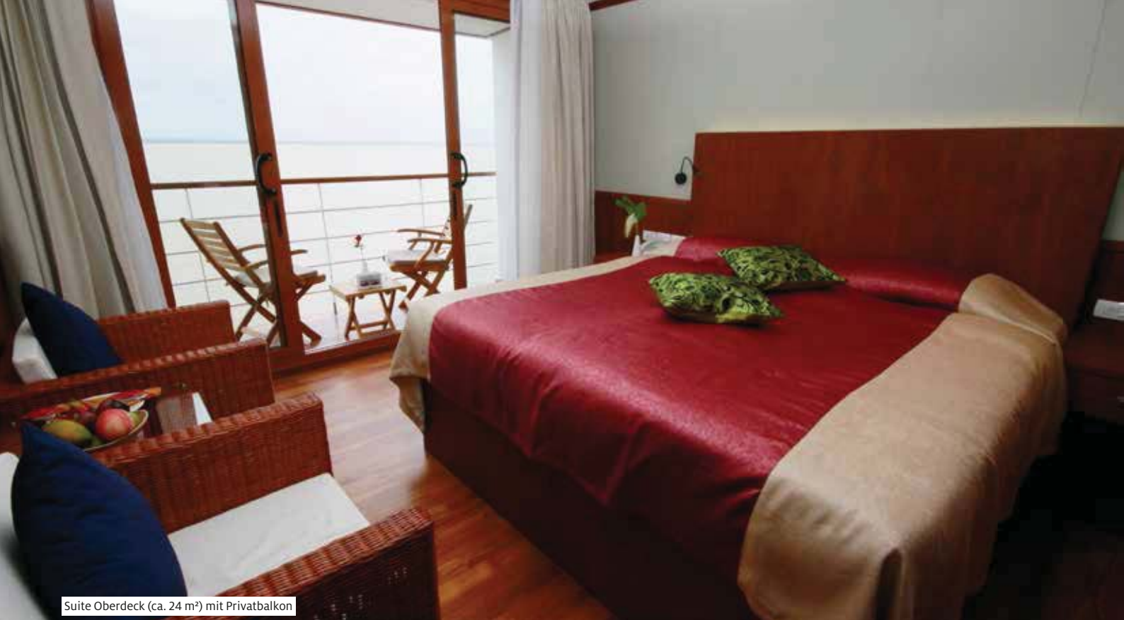
Suite Oberdeck (ca. 24 m 2 ) mit Privatbalkon