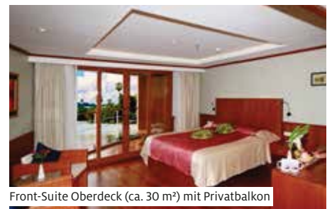
Front-Suite Oberdeck (ca. 30 m 2 ) mit Privatbalkon

Die RV Thurgau Exotic 3 wurde in Burma im Kolonialstil gebaut (Baujahr 2017) und mit regionalen Harthölzern, wertvollen Möbeln und landestypischen Bildern ausgestattet. Das Schiff überzeugt durch eine einzigartige, elegante Ausstattung. Die geringe Anzahl von 32 Gästen trägt zur ausserordentlich familiären Atmosphäre bei. Die 2-Bettkabinen Standard auf dem Hauptdeck (ca. 16 m 2 ) und Suiten (ca. 24 m 2 ) verfügen über Dusche/WC, Föhn, Minibar, Safe und individuell regulierbare Klimaanlage. Die Suiten erstrecken sich über die gesamte Breite des Schiffes. Vom Schlaf- sowie vom Wohnraum der Suiten auf dem Hauptdeck gelangt man beidseitig auf die Deck-Promenade. Die Suiten auf dem Oberdeck (ca. 24 m 2 ) sowie die Front Suiten (ca. 30 m 2 ) sind einseitig begehbar und verfügen zusätzlich über einen Privatbalkon. Im Restaurant finden alle Gäste gleichzeitig Platz. Eine kleine Salonbar befindet sich auf dem überdachten Sonnendeck. Das kleine, aber feine Flussschiff wurde von erfahrenen burmesischen Schiffsbauern nach westlichen Anforderungen sowie den Vorstellungen der Familie Kaufmann gebaut. Nichtraucher Schiff (Rauchen auf dem Sonnendeck erlaubt).