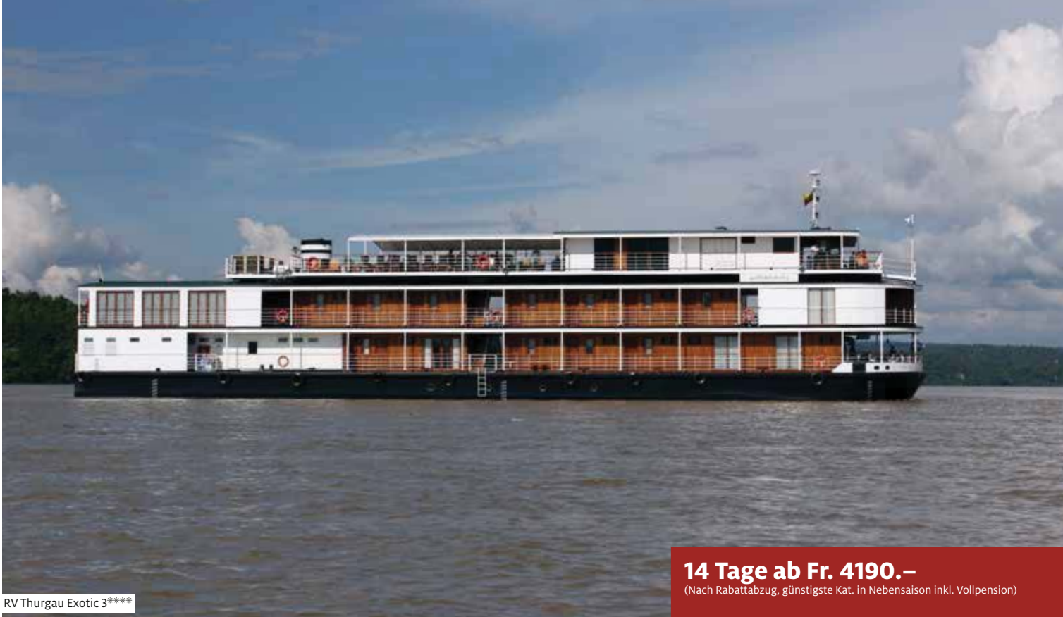
RV Thurgau Exotic 3****