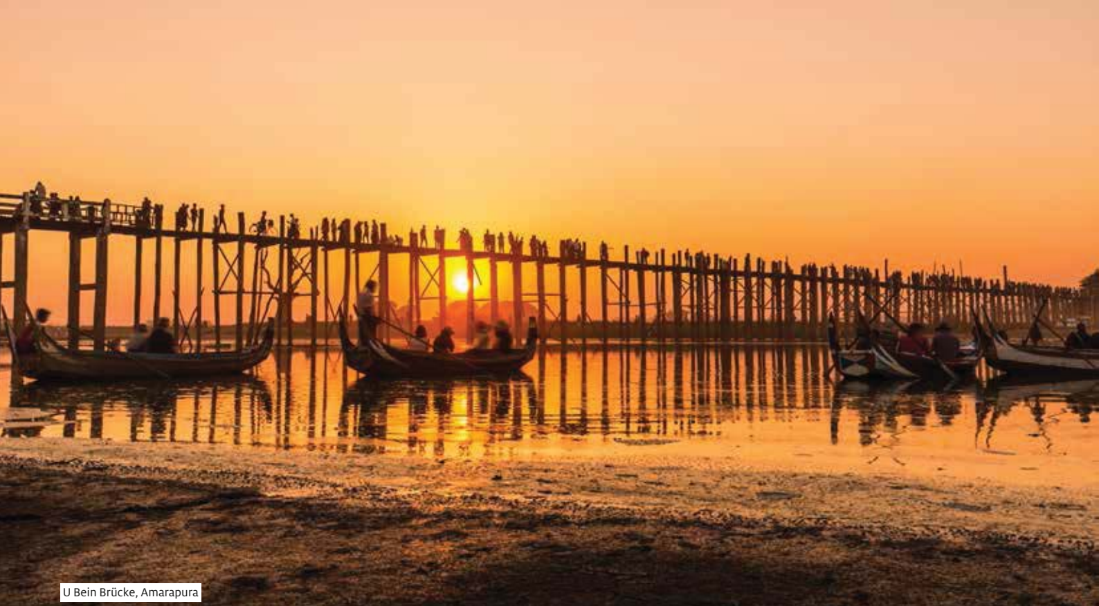
U Bein Brücke, Amarapura