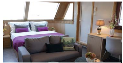
2-Bett VIP Promenadendeck (ca. 21 m²), eigener Aussenbereich