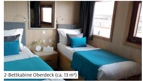
2-Bettkabine Oberdeck (ca. 13 m²)