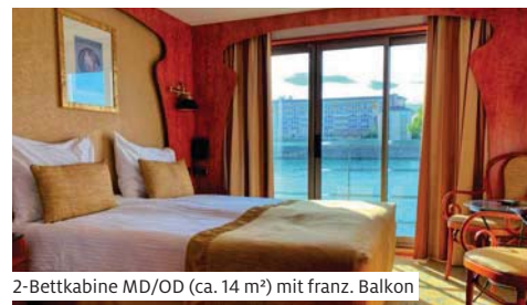
2-Bettkabine MD/OD (ca. 14 m 2 ) mit franz. Balkon