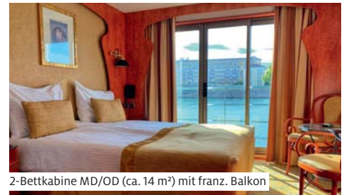
2-Bettkabine MD/OD (ca. 14 m 2 ) mit franz. Balkon