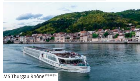
MS Thurgau Rhône*****