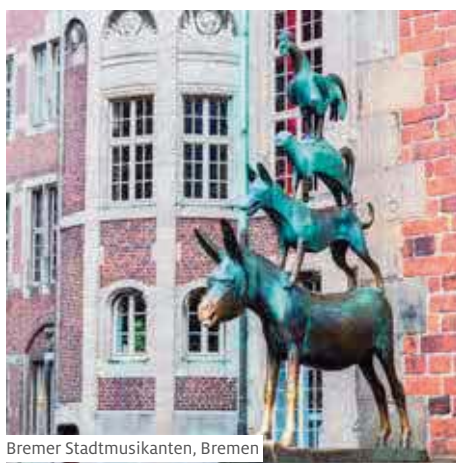
Bremer Stadtmusikanten, Bremen