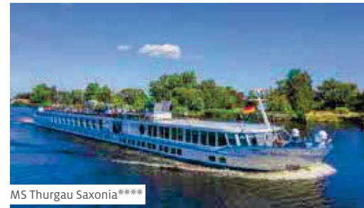
MS Thurgau Saxonia****