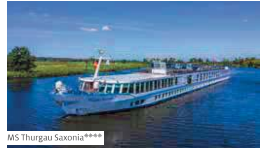
MS Thurgau Saxonia****