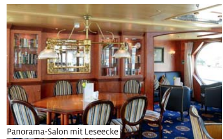
Panorama-Salon mit Lesecke