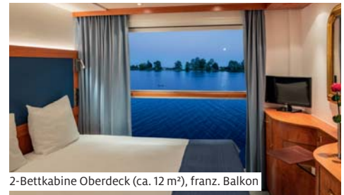
2-Bettkabine Oberdeck (ca. 12 m²), franz. Balkon