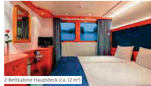
2-Bettkabine Hauptdeck (ca. 12 m 2 )