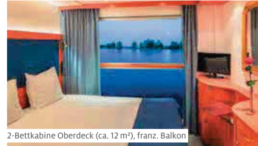
2-Bettkabine Oberdeck (ca. 12 m 2 ), franz. Balkon