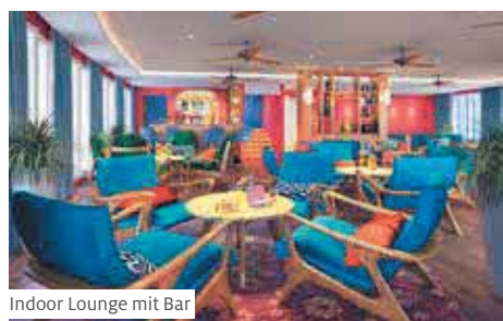
Indoor Lounge mit Bar

Flüsse Asiens und weltweit 124 NEU Sibsagar–Kalkutta–Prayagraj v.v.