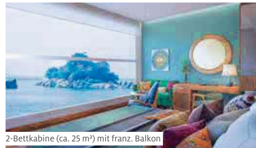
2-Bettkabine (ca. 25 m²) mit franz. Balkon