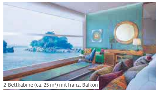
2-Bettkabine (ca. 25 m²) mit franz. Balkon