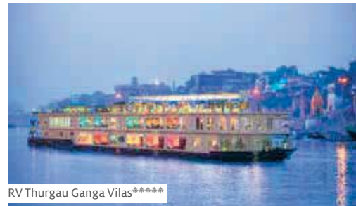
RV Thurgau Ganga Vilas*****