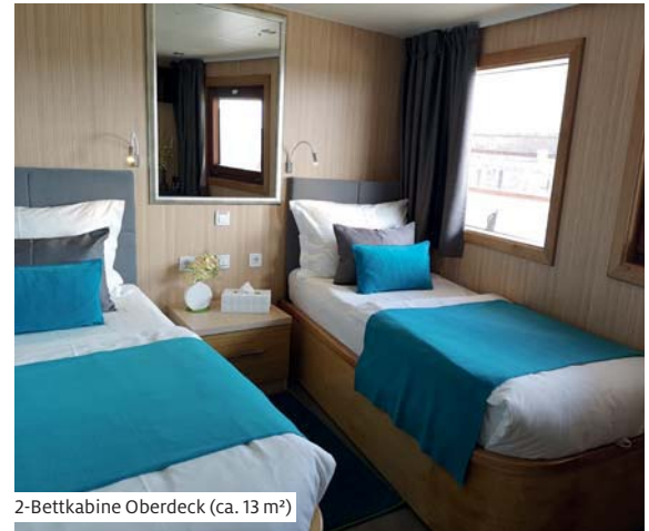
2-Bettkabine Oberdeck (ca. 13 m²)