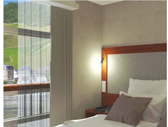
2-Bettkabine Oberdeck (ca. 12 m 2 ), franz. Balkon (Illustrationsbild)