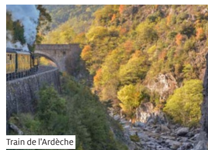
Train de l'Ardèche