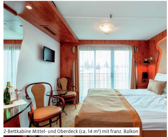
2-Bettkabine Mittel- und Oberdeck (ca. 14 m 2 ) mit franz. Balkon