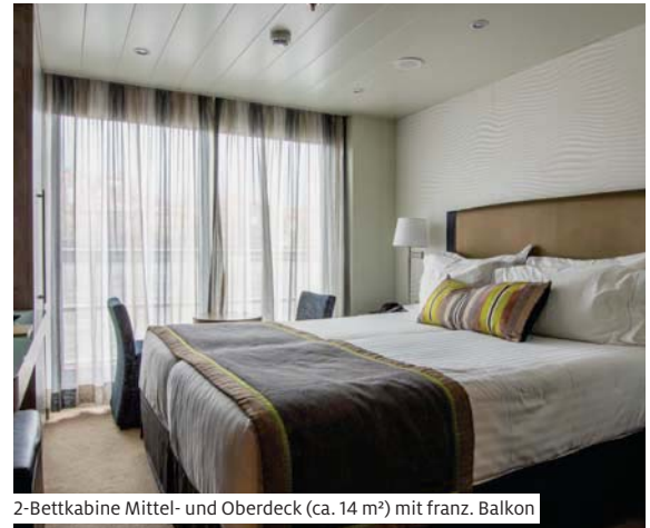
2-Bettkabine Mittel- und Oberdeck (ca. 14 m²) mit franz. Balkon