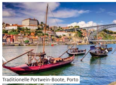
Traditionelle Portwein-Boote, Porto