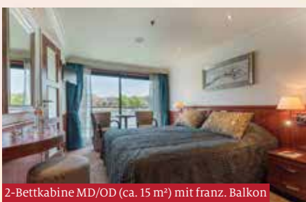
2-Bettkabine MD/OD (ca. 15 m 2 ) mit franz. Balkon