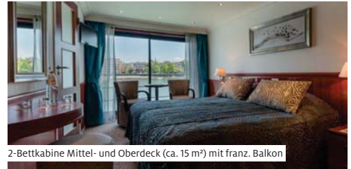
2-Bettkabine Mittel- und Oberdeck (ca. 15 m²) mit franz. Balkon