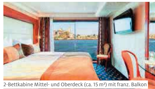
2-Bettkabine Mittel- und Oberdeck (ca. 15 m²) mit franz. Balkon