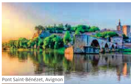
Pont Saint-Bénézet, Avignon