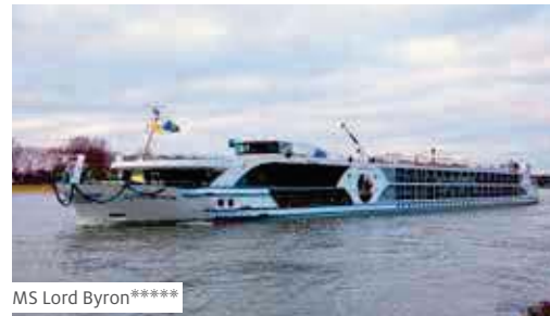
MS Lord Byron*****