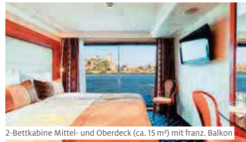
2-Bettkabine Mittel- und Oberdeck (ca. 15 m²) mit franz. Balkon