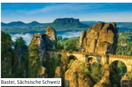
Bastei, Sächsische Schweiz