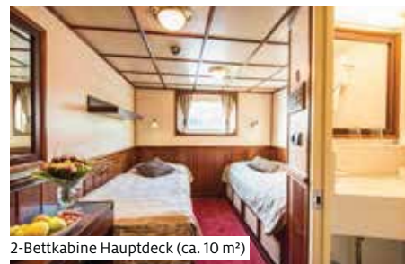
2-Bettkabine Hauptdeck (ca. 10 m 2 )

Das gemütliche Mittelklassenschiff wurde ab 2013 kontinuierlich renoviert. Es bietet 86 Gästen in 46 Kabinen bequem Platz. Alle Kabinen (2-Bettkabine ca. 10 m 2 , Einzelkabine ca. 8 m 2 ) liegen aussen und verfügen über Dusche/WC, Föhn, Safe, TV sowie regulierbare Lüftung mit zentral gesteuerter Heizung/Klimaanlage. Die im Design unserer Burma-Schiffe gestalteten Kabinen haben auf dem Oberdeck einen französischen Balkon und auf dem Hauptdeck nicht zu öffnende Fenster. Gutbürgerliche, nationale und internationale Speisen werden im Restaurant mit Bar serviert. Angenehmen Aufenthalt bieten die kleine Lounge bei der Réception sowie der Panorama-Salon auf dem Oberdeck. Das grosse Sonnendeck mit Stühlen und Liegen lädt während der Fahrt zur Erholung und Entspannung ein. Gratis WLAN nach Verfügbarkeit. Nichtraucherschiff (Rauchen auf dem Sonnendeck erlaubt).