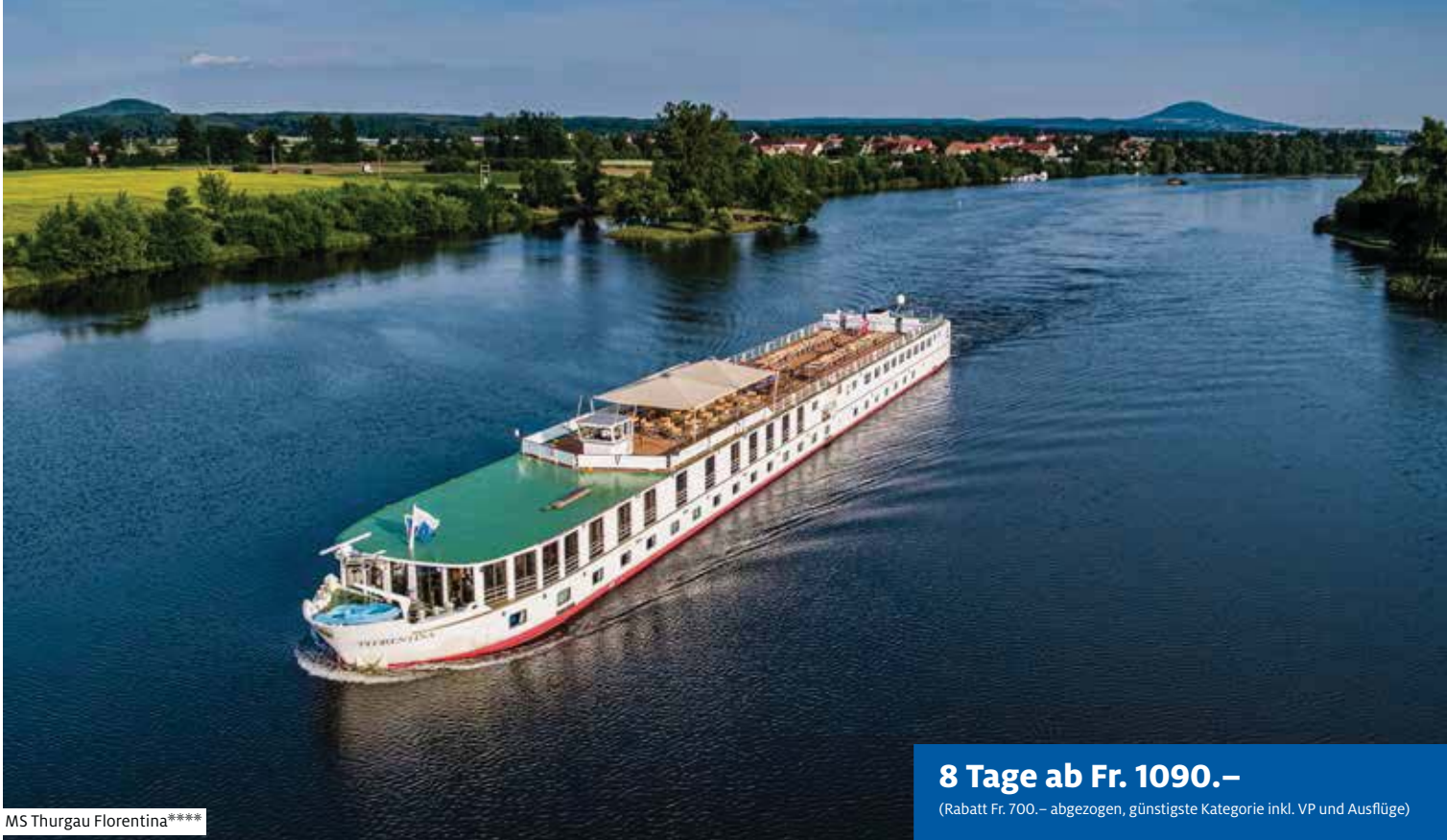
MS Thurgau Florentina****