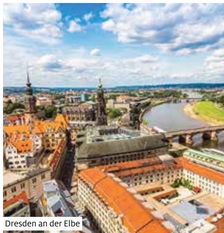
Dresden an der Elbe

Ausschiffung und Bustransfer via Hetzenhausen in die Schweiz (Mittagessen auf eigene Kosten). Ankunft in St. Margrethen Bahnhofplatz um ca. 17.30 Uhr und Zürich Flughafen um ca. 19.00 Uhr. Individuelle Heimreise.