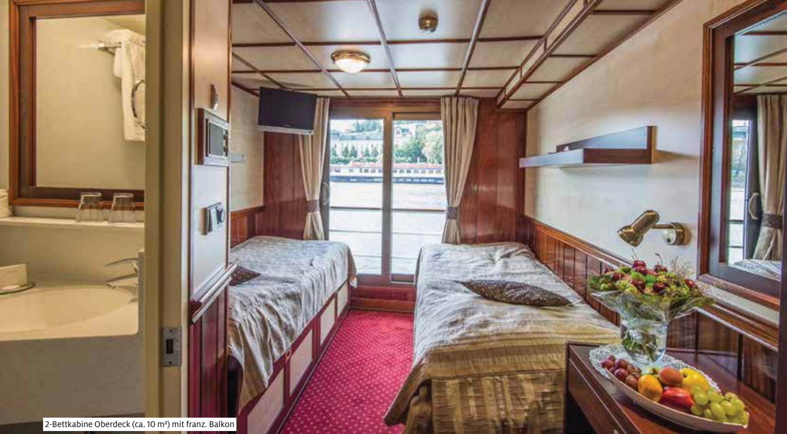
2-Bettkabine Oberdeck (ca. 10 m 2 ) mit franz. Balkon