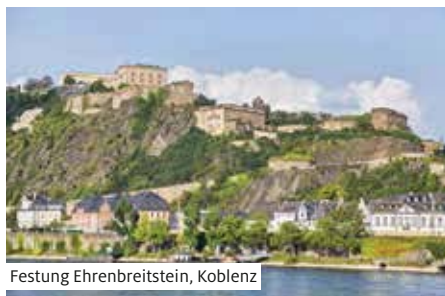
Festung Ehrenbreitstein, Koblenz

Ausschiffung nach dem Frühstück und individuelle Heimreise.