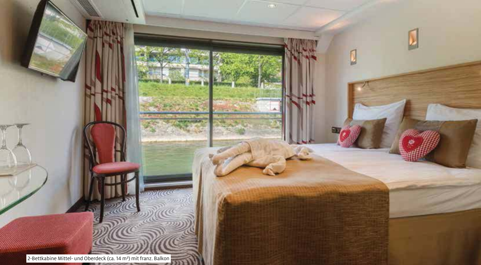
2-Bettkabine Mittel- und Oberdeck (ca. 14 m 2 ) mit franz. Balkon