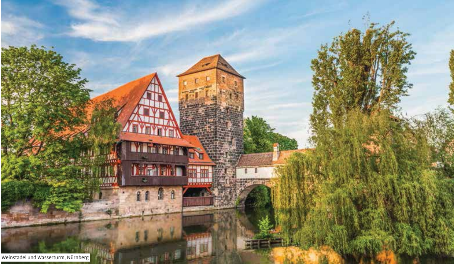
Weinstadel und Wasserturm, Nürnberg