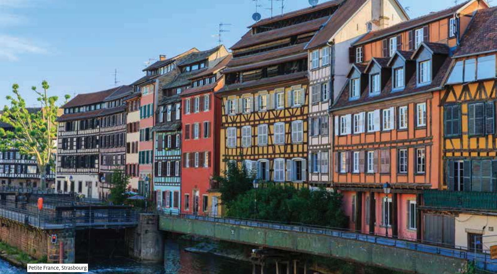
Petite France, Strasbourg