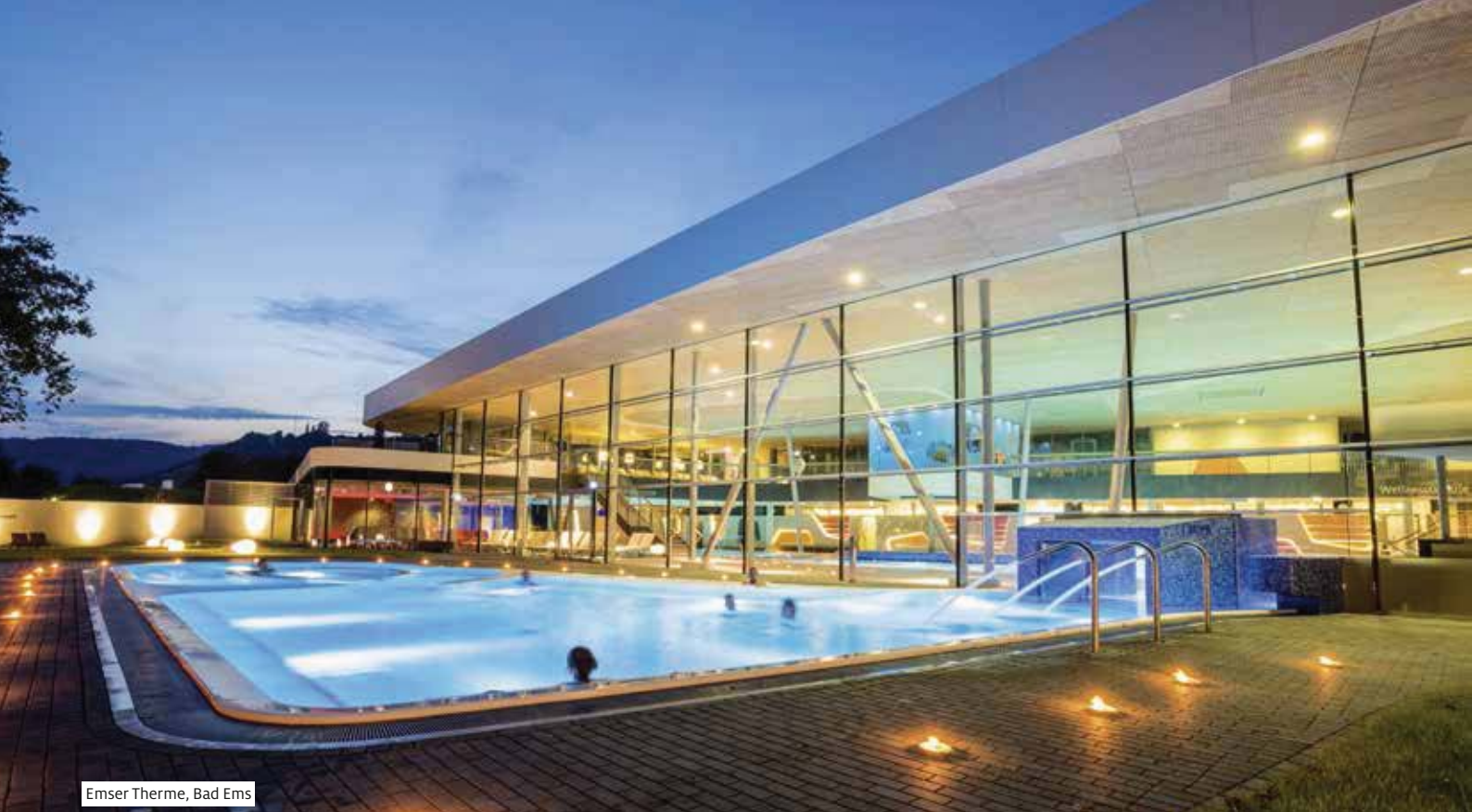
Emser Therme, Bad Ems