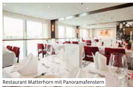
Restaurant Matterhorn mit Panoramafenstern