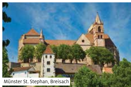
Münster St. Stephan, Breisach

Diese Kurzreise ist auch für Firmen und Familienanlässe geeignet. Ab 10 Personen gibt es einen Gruppenrabatt von 5 % auf das Pauschalarrangement.