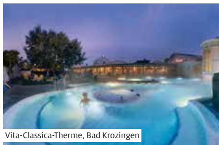
Vita-Classica-Therme, Bad Krozingen

Nach dem Frühstück Ankunft in Basel. Ausschiffung und individuelle Heimreise.