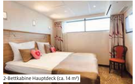
2-Bettkabine Hauptdeck (ca. 14 m 2 )

Das luxuriöse Schiff der Scylla-Flotte nahm 2013 seinen Dienst auf. In 90 Kabinen finden 180 Personen Platz. Die grosszügigen, modernen Kabinen (ca. 14 m 2 ) sind mit Dusche/WC, Föhn, Kühlschrank, Safe, TV/Radio und individuell regulierbarer Klimaanlage ausgestattet. Auf Mittel- und Oberdeck verfügen die Kabinen über einen französischen Balkon. Die Fenster der Kabinen auf dem Hauptdeck lassen sich aus Sicherheitsgründen nicht öffnen. Die Gäste von Haupt- und Mitteldeck speisen im Restaurant Jungfrau mit Oberlichtfenstern, die Gäste des Oberdecks im Restaurant Matterhorn mit Panoramafenstern. Alternativ dazu gibt es mittags einen «Light-Lunch» (Buffet) im Panorama-Salon. Zur Bordausstattung gehören Réception, Schiffsboutique, stilvoll eingerichteter Panorama-Salon mit Bar und komfortable Lido-Bar mit Aussenterrasse. Das grosse Sonnendeck bietet Putting Green, kleinen Pool, kleine Aussichtsterrasse am Bug sowie Schattenplätze mit Liegestühlen und Sitzgruppen. Lift zwischen Haupt- und Oberdeck. Gratis WLAN nach Verfügbarkeit. Nichtraucher Schiff (Rauchen auf dem Sonnendeck erlaubt).