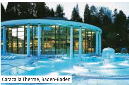
Caracalla Therme, Baden-Baden

Ankunft in Koblenz am frühen Morgen. Am Vormittag Busfahrt (1) nach Bad Ems zum Besuch der Emser Therme oder freie Zeit in Koblenz. Lauschen Sie den interessanten Ausführungen eines Einheimischen über die einzigartige Kulturlandschaft während der Passage des «Romantischen Rheins». Neben bewachsene Steilhänge, beeindruckende Felsen wie die Loreley sowie trutzige Burgen prägen das Mittelrheintal und sind Inbegriff der Rheinromantik.