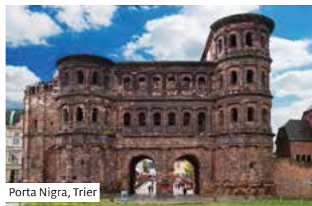
Porta Nigra, Trier

Ausschiffung nach dem Frühstück und individuelle Heimreise.