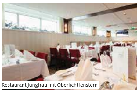
Restaurant Jungfrau mit Oberlichtfenstern