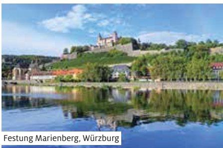
Festung Marienberg, Würzburg

Ankunft in Würzburg. Transfer (1) in die Innenstadt und Besuch der bischöflichen Residenz. Der Rundgang zeigt die Höfe und Burghäuser der Altstadt sowie die Baudenkmäler dieser Barockstadt.