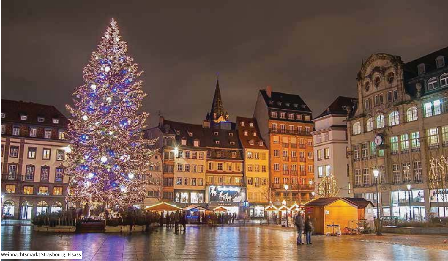
Weihnachtsmarkt Strasbourg, Elsass