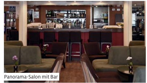
Panorama-Salon mit Bar