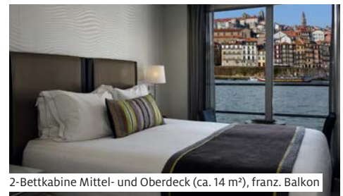
2-Bettkabine Mittel- und Oberdeck (ca. 14 m²), franz. Balkon