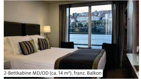
2-Bettkabine MD/OD (ca. 14 m 2 ), franz. Balkon

Pinhão. Nachmittags Besuch (1) der Quinta do Seixo mit Weinverkostung. Die Wiedereinschiffung erfolgt in Régua.