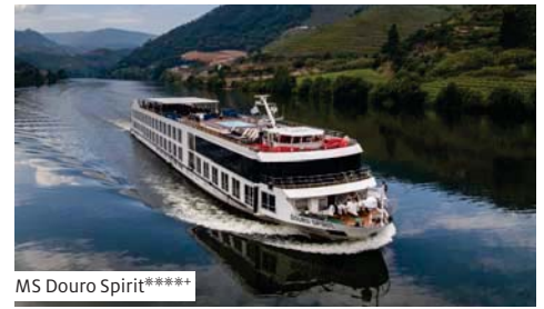
MS Douro Spirit****+