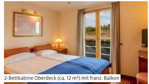
2-Bettkabine Oberdeck (ca. 12 m²) mit franz. Balkon