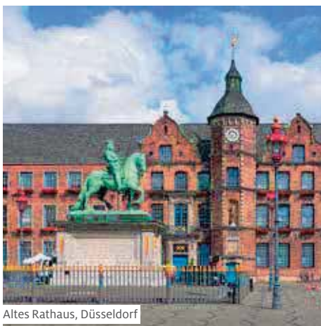
Altes Rathaus, Düsseldorf

www.zihlmann-zeitreisen.ch wuensche@zihlmann-zeitreisen.ch