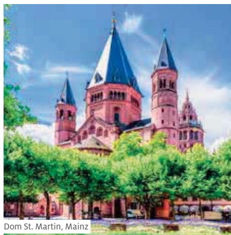
Dom St. Martin, Mainz