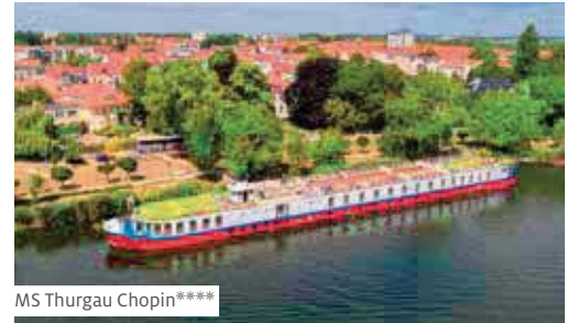
MS Thurgau Chopin****