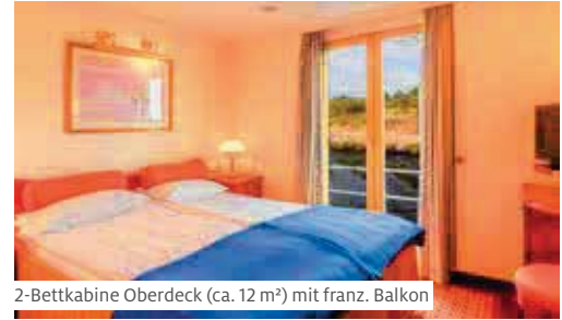
2-Bettkabine Oberdeck (ca. 12 m 2 ) mit franz. Balkon