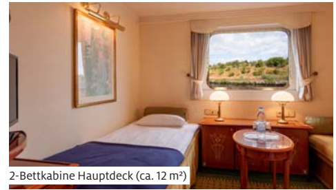
2-Bettkabine Hauptdeck (ca. 12 m²)