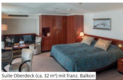
Suite Oberdeck (ca. 32 m²) mit franz. Balkon