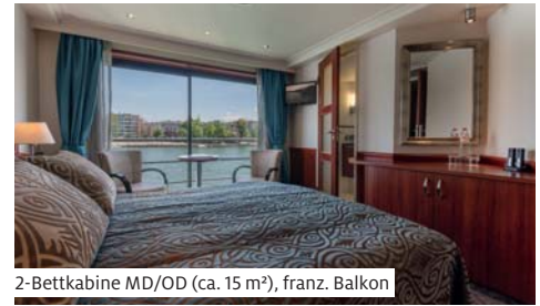
2-Bettkabine MD/OD (ca. 15 m²), franz. Balkon