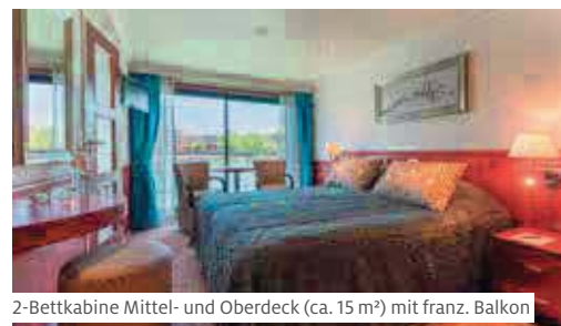
2-Bettkabine Mittel- und Oberdeck (ca. 15 m²) mit franz. Balkon