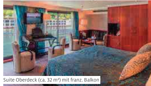
Suite Oberdeck (ca. 32 m 2 ) mit franz. Balkon