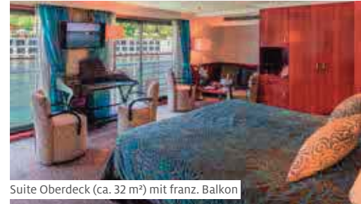
Suite Oberdeck (ca. 32 m²) mit franz. Balkon