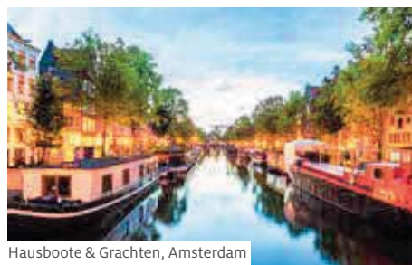
Hausboote & Grachten, Amsterdam