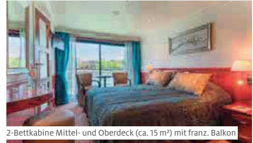
2-Bettkabine Mittel- und Oberdeck (ca. 15 m²) mit franz. Balkon