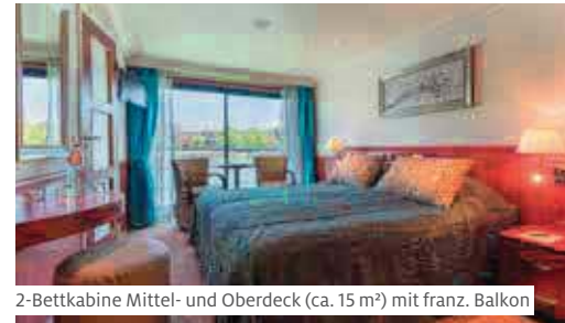
2-Bettkabine Mittel- und Oberdeck (ca. 15 m²) mit franz. Balkon

haben Sie Zeit, Amsterdam individuell zu erkundigen. Am Abend Grachtenfahrt (2) durch das Zentrum.