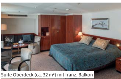
Suite Oberdeck (ca. 32 m²) mit franz. Balkon