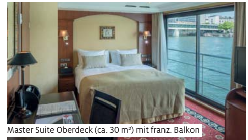
Master Suite Oberdeck (ca. 30 m²) mit franz. Balkon