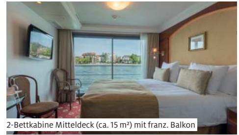
2-Bettkabine Mitteldeck (ca. 15 m²) mit franz. Balkon