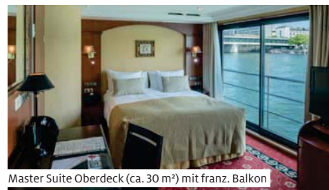
Master Suite Oberdeck (ca. 30 m²) mit franz. Balkon