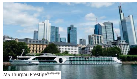
MS Thurgau Prestige*****