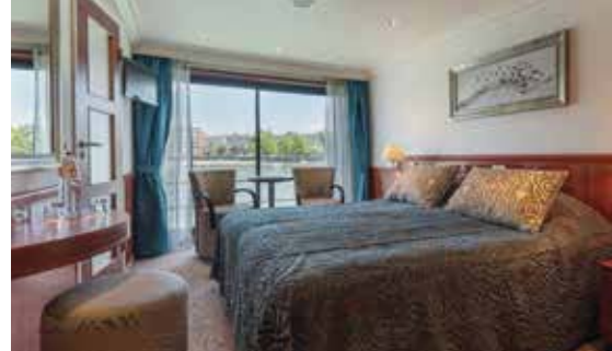
2-Bettkabine Mittel- und Oberdeck (ca. 15 m 2 ) mit franz. Balkon