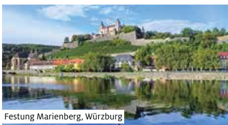
Festung Marienberg, Würzburg

Informationen im Internet oder Katalog bestellen.