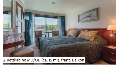
2-Bettkabine MD/OD (ca. 15 m 2 ), franz. Balkon

Amsterdam individuell zu erkundigen. Am Abend Grachtenfahrt (2) durch das Zentrum.