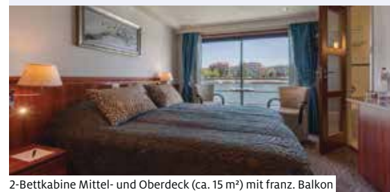
2-Bettkabine Mittel- und Oberdeck (ca. 15 m 2 ) mit franz. Balkon