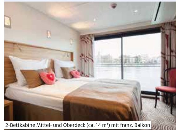
2-Bettkabine Mittel- und Oberdeck (ca. 14 m 2 ) mit franz. Balkon