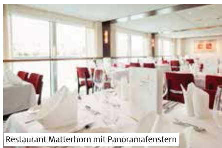
Restaurant Matterhorn mit Panoramafenstern