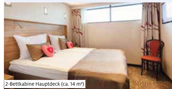
2-Bettkabine Hauptdeck (ca. 14 m 2 )