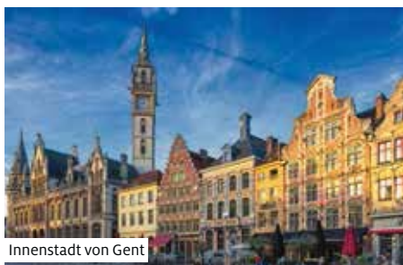
Innenstadt von Gent

15. Tag Basel Ausschiffung nach dem Frühstück und individuelle Heimreise.