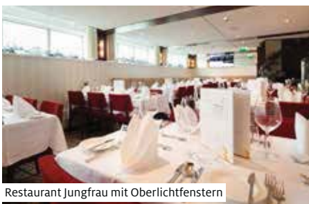
Restaurant Jungfrau mit Oberlichtfenstern