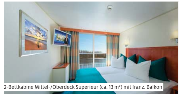
2-Bettkabine Mittel-/Oberdeck Superieur (ca. 13 m²) mit franz. Balkon