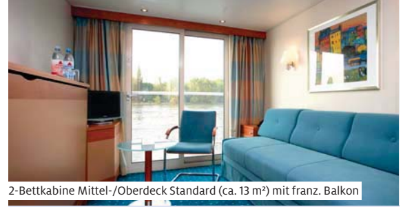
2-Bettkabine Mittel-/Oberdeck Standard (ca. 13 m²) mit franz. Balkon