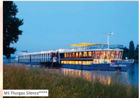
MS Thurgau Silence****