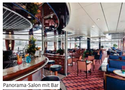
Panorama-Salon mit Bar