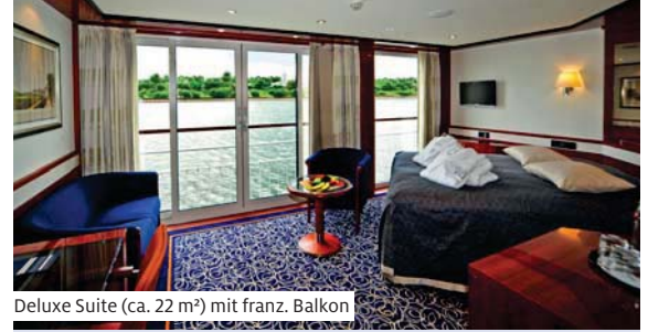
Deluxe Suite (ca. 22 m 2 ) mit franz. Balkon