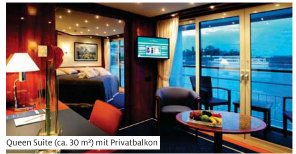
Queen Suite (ca. 30 m 2 ) mit Privatbalkon