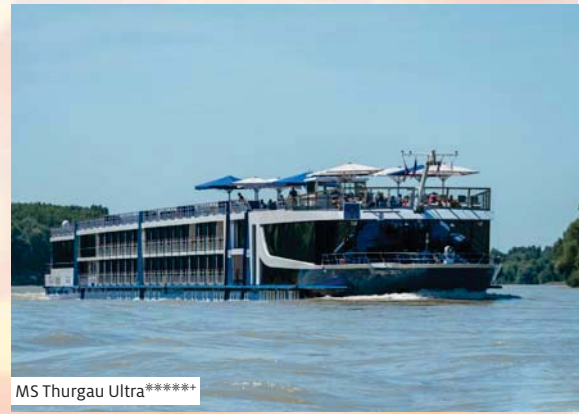
MS Thurgau Ultra*****

Es het solangs het Rabatt* bis Fr. 500.– *Abhängig von Auslastung, Saison, Wechselkurs