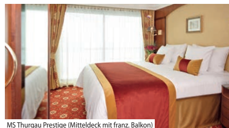
MS Thurgau Prestige (Mitteldeck mit franz. Balkon)

Bordausstattung: Foyer mit Réception, Shop, grosszügiges Restaurant, grosser Panorama-Salon mit Tanzfläche und Bar sowie der Sauna- und Fitnessbereich, Sonnendeck mit Whirlpool, Liegestühlen und Sonnenschirmen. Gratis WLAN nach Verfügbarkeit. Lift vom Mittel- bis Oberdeck. Nichtraucher-schiff (Rauchen auf dem Sonnendeck erlaubt).