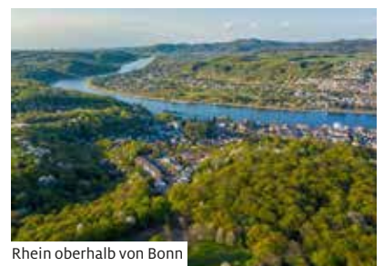
Rhein oberhalb von Bonn