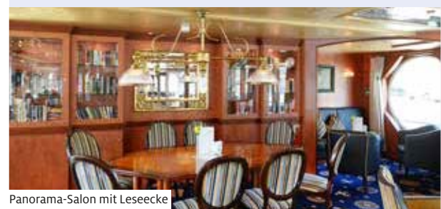
Panorama-Salon mit Lesecke