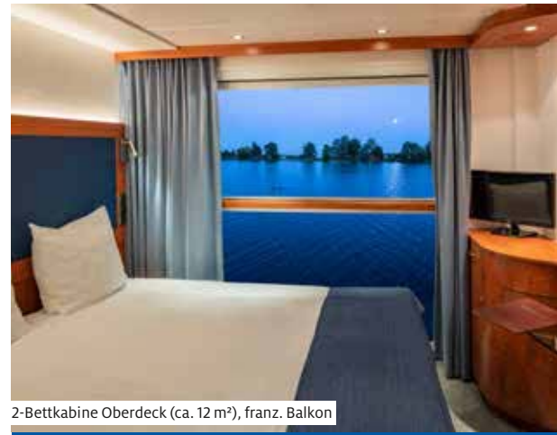
2-Bettkabine Oberdeck (ca. 12 m²), franz. Balkon